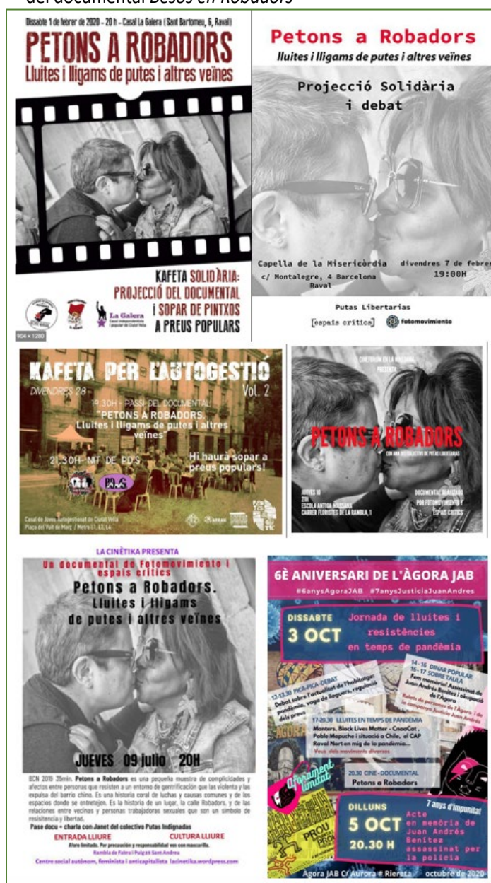
Imagen 1: Carteles de algunos de los pases en Barcelona del documental Besos en Robadors

Fuente: Elaboración propia a partir de los carteles difundidos por las entidades organizadoras de los eventos. Fotografía en blanco y negro de Pedro Mata.