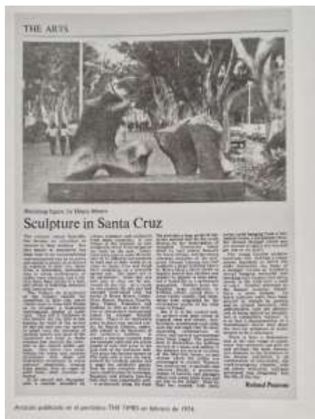
Fig. 8: Figura recostada , 1963. Henry Moore. Foto del artículo escrito por Roland Penrose en The Times , tratada por Carlos Pallés.

La escultura de Henry Moore llega a la exposición en diciembre de 1973, y es tal la expectación que despierta que el mismo Roland Penrose escribirá un artículo sobre la exposición de Escultura en la Calle, que se publica en The Times en febrero de 1974.