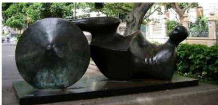
Fig. 11. El Guerrero de Goslar , Henry Moore, en la Rambla Santa Cruz.

vender y conseguir el dinero, además del dinero que donaron empresas de Tenerife” (Ramos-Yzquierdo, 2024).