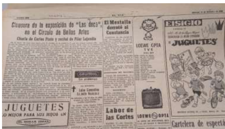
Fig. 5. Artículo de El Día , 12 de diciembre de 1965, pág. 6. Hemeroteca de la Universidad de La Laguna (Clausura de la exposición de "Las doce" en el Círculo de Bellas Artes, 1965)