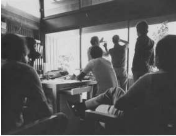
Fig. 7. Escultores reunidos para la exposición.