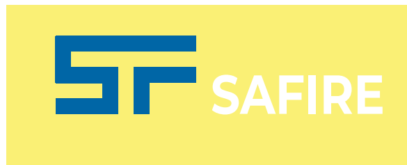
Mal ús en fons clar