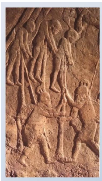
Imatge d'empalaments siris.