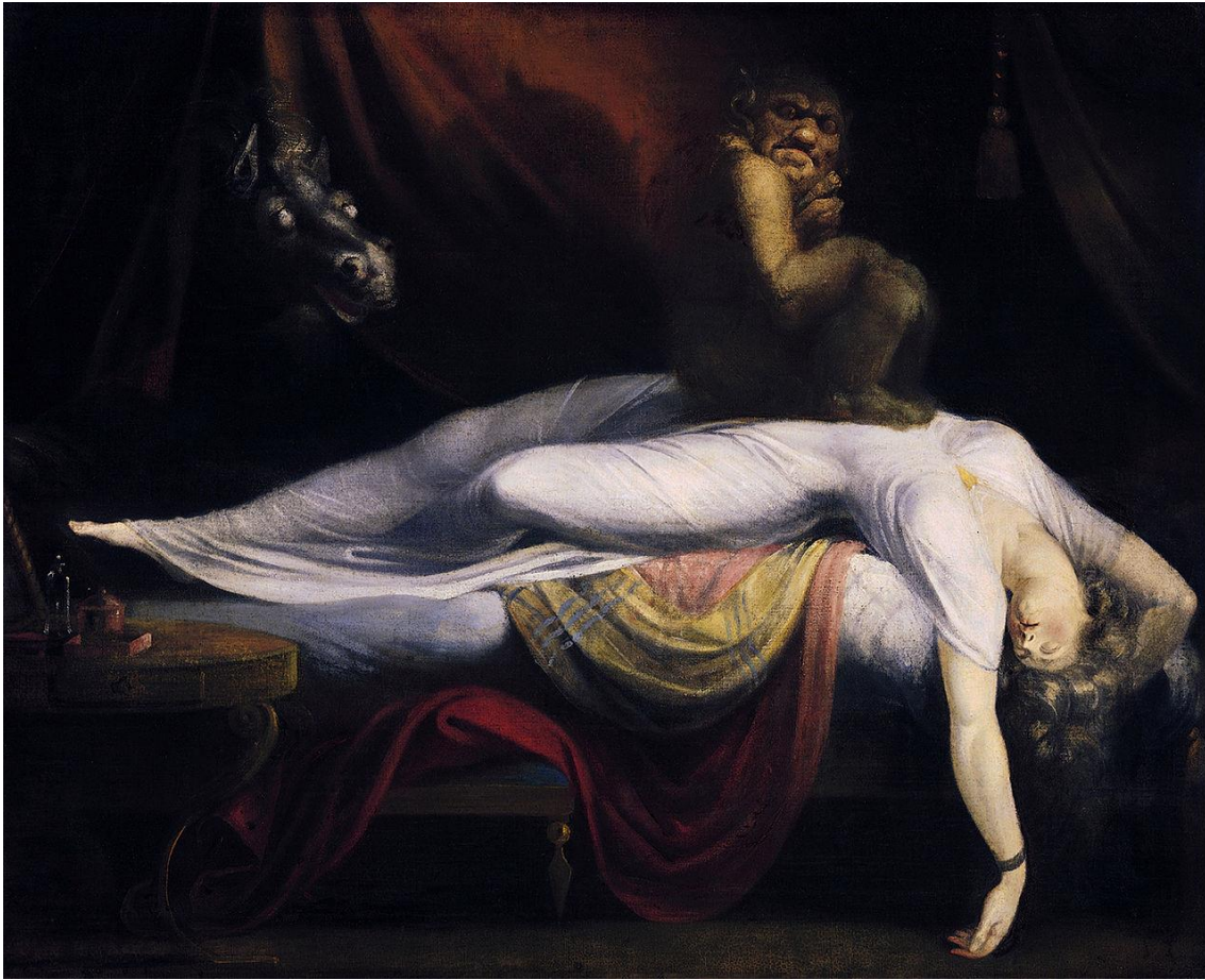
Johann Henry Füssli, El malson , 1781, oli, 101 x 127 cm. Detroit Institute of Arts. Disponible en línia a: https://historia-arte.com/obras/la-pesadilla