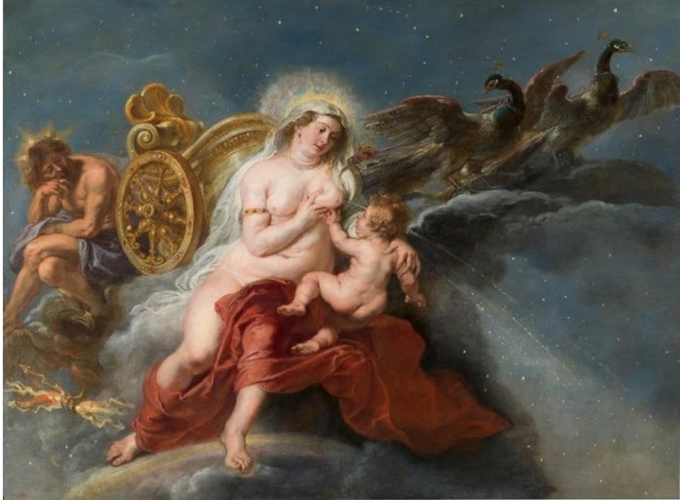
Peter Paul Rubens. El naixement de la Via Làctia (1636-1638). Oli sobre llenç, 181 x 244 cm, sala 079, Museo del Prado (Madrid).

369. Una de las Atlántidas con la que Júpiter mantuvo relaciones y cuyo fruto fue el propio Mercurio, v. supra , II, 7, 2. Cfr. Hes., Teog. 938 ss. 370. Diosa de la abundancia. Con frecuencia se la ha identificado con Rea. Cfr. Fab. CXXXIX.