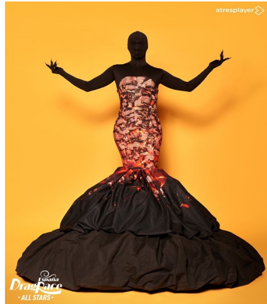
Imagen 14. Alexvnderh. (s.f.). Drag Sethlas Inferno look [Fotografía]. En: Fandom Wiki. https://rupaulsdragrace.fandom.com/wiki/Drag_Sethlas?file=DragSethlasHellLook.jpg .