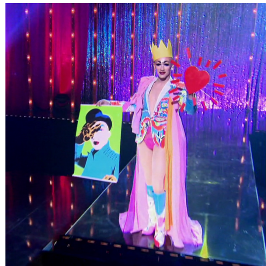
Imagen 16. CristobalACS. (s.f.). Sasha Velour Hometown look [Fotografía]. En: Fandom Wiki. https://rupaulsdragrace.fandom.com/wiki/Sasha_Velour?file=VelourEp1LookB.png .