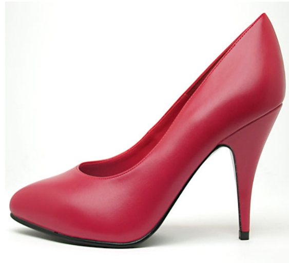
Imagen 8. Almighty1. (2005). Red High Heel Pumps [Fotografía]. En: Wikimedia Commons. https://commons.wikimedia.org/wiki/File:Red_High_Heel_Pumps.jpg .