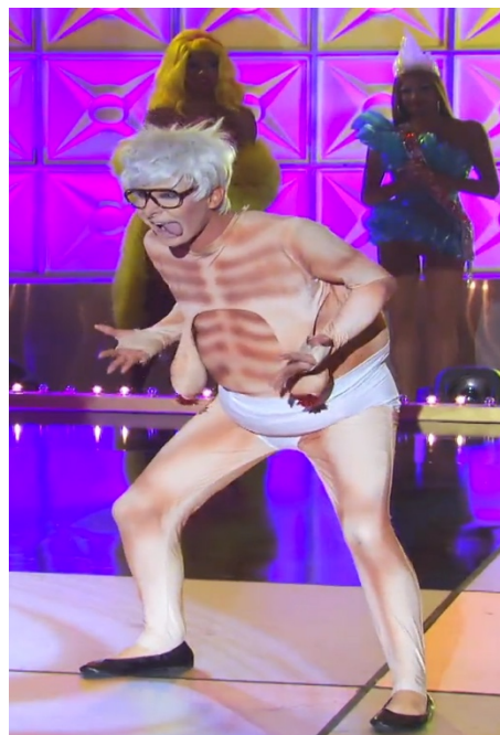
Imagen 10. AlexanderRous. (s.f.). Trinity the Tuck old lady [Fotografía]. En: Fandom Wiki. https://rupaulsdragrace.fandom.com/wiki/Trinity_The_Tuck?file=TrinityEpisode7LipSyncRevealLook.png .