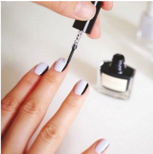
Imagen 7. Alba6arrido. (2016). Estética de uñas . [Fotografía]. En: Wikimedia Commons. https://es.wikipedia.org/wiki/Est%C3%A9tica_de_u%C3%B1as#/media/Archivo:Estetica_de_u%C3%B1as.jpg .