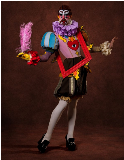
Imagen 15. Hugáceo Crujiente. (2022). Hugáceo Crujiente Cervantes look . [Fotografía]. En: bycrujiente.com https://www.bycrujiente.com/work/ .