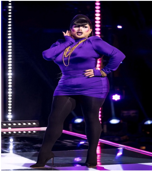
Imagen 19. Bren2310. (s.f.). Danny Beard She betta Don't look [Fotografía]. En: Fandom Wiki. https://rupaulsdragrace.fandom.com/wiki/Danny_Beard#RuPaul's_Drag_Race_UK_Season_4_Looks .