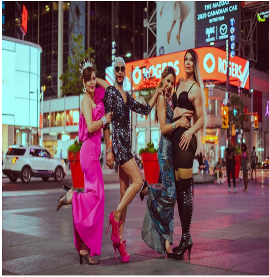
Imagen 5. Pixoos. (2020). Drag Queens in Toronto . [Fotografía]. En: Wikimedia Commons. https://commons.wikimedia.org/wiki/File:Drag_Queen_in_Toronto_by_Pouria_Afkhami_pixoos_12.jpg .