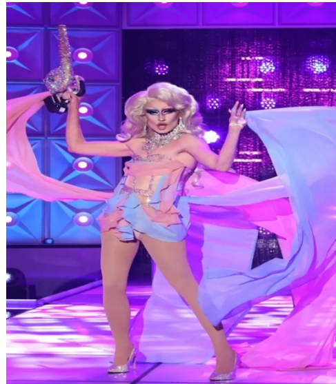
Imagen 22. Mirezhzz (s.f.). Gottmik Train look [Fotografía]. En: Fandom Wiki. https://rupaulsdragrace.fandom.com/wiki/Gottmik?file=GottmikTrainLook.jpg .