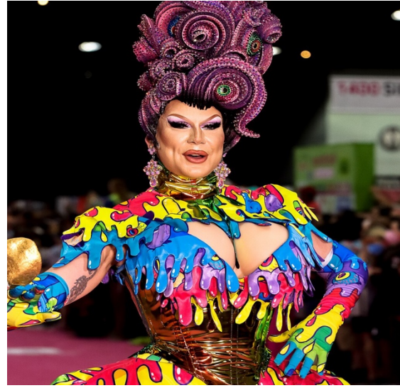
Imagen 6. DVSROSS. (2023). Jimbo Prótesis mamaria . [Fotografía]. En: Wikimedia Commons. https://commons.wikimedia.org/wiki/File:DragCon_2023_@_DVSROSS_Photgraphy_-34_(cropped).jpg .