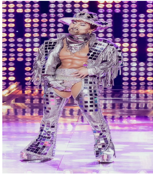
Imagen 20. DominkLaTroja (s.f.). Pandora Nox Glitter Party look [Fotografía]. En: Fandom Wiki. https://rupaulsdragrace.fandom.com/wiki/Pandora_Nox#Drag_Race_Germany_Season_1_Looks .