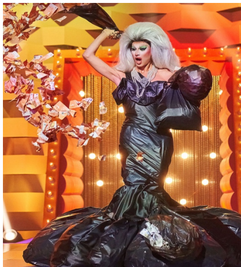
Imagen 11. Lovelicki. (s.f.). Pitita Bolsas de Basura . [Fotografía]. En: Fandom Wiki. https://rupaulsdragrace.fandom.com/wiki/Pitita?file=PititaSpainsDifferentLook.jpg .