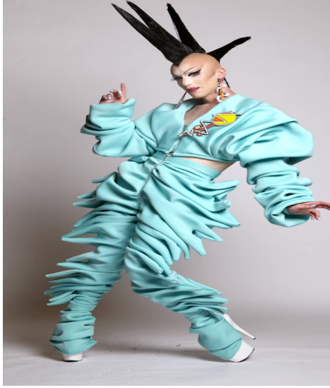
Imagen 23. Zeqe. (s.f.). Sasha Velour Reunion Look [Fotografía]. En: Fandom Wiki. https://rupaulsdragrace.fandom.com/wiki/Sasha_Velour?file=SashaVelourReunion.png .