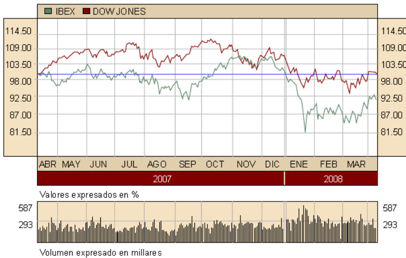
Figura 2. Mercados interconectados: evolución de los índices Ibex y Dow Jones.

Lo primero que debe destacarse es la doble dimensión del mismo, es decir, las transacciones monetarias o los créditos pueden surgir como consecuencia lógica del comercio de bienes y servicios, pero lo cierto es que este tráfico financiero es muy escaso si lo comparamos con los mercados de especulación, donde las diferentes bolsas son los principales exponentes.