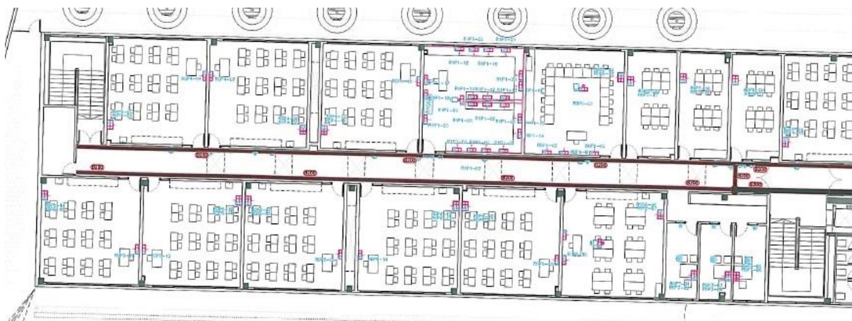
Planta primera esquerra