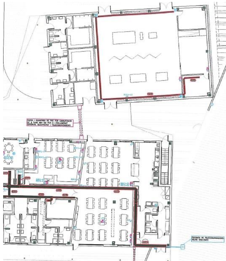
Planta baixa dreta

El cost hauria de ser el mínim possible, enguany, el Departament d'Ensenyament no ha dotat l'escola amb cap equipament. Es disposa d'una inversió per part de l'AFA per millorar l'equipament actual.