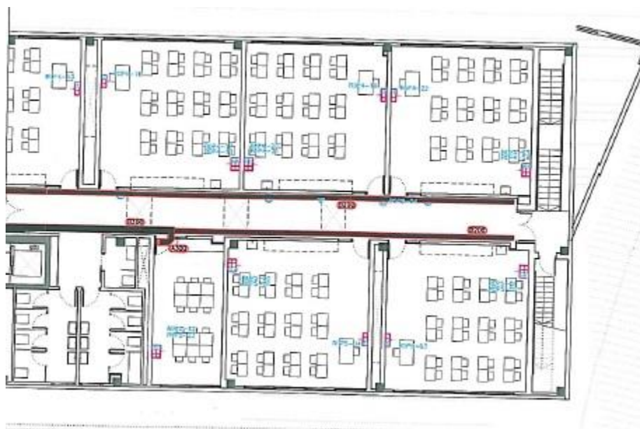
Planta primeira direita