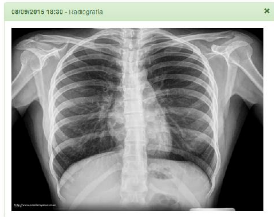
Visualització Prova Imatge a MediVirt