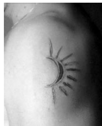
Branding en un braç