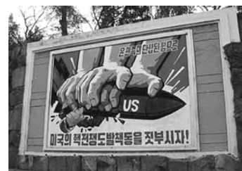
Propaganda nord-coreana antiamericana

Com hem vist en tractar les relacions entre els EUA i aquesta regió, el sud-est asiàtic va ser escenari de diverses guerres durant l'etapa de la guerra freda i va estar àmpliament sotmès a les tensions inherents a l'ordre mundial bipo-