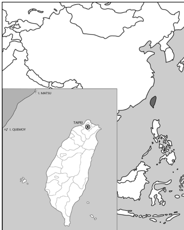
La província xinesa de Fujian està formada per la península continental i per les illes que hi ha a l'estret de Taiwan: Kinmen county (Quemoy) i part del Lianjiang county (Matsu)

Aquest distanciament ideològic entre Moscou i Beijing va quedar plasmat en el pla pràctic per mitjà de tres episodis que es van produir entre el 1959 i el 1962: el bombardeig de Quemoy i Matsu per part de Xina, la visita de Khrushchev a Beijing i la firma d'un acord entre Albània i la Xina.