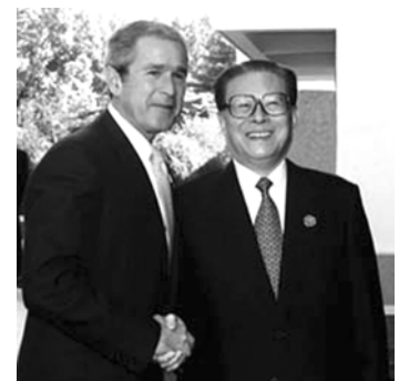
Jiang Zemin i George Bush, octubre del 2001

Hoy en día, a pesar de los grandes cambios experimentados en la situación internacional en los últimos 30 años, no ha variado la importancia estratégica de las relaciones sino-norteamericanas. China y EE.UU. comparten responsabilidades y asumen amplias perspectivas de cooperación en el mantenimiento de la paz y estabilidad en la región de Asia y Pacífico y en todo el mundo, en la promoción del crecimiento económico y la prosperidad de sus respectivos países y del globo, y en la lucha contra el terrorismo.