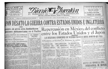
El Japó va desencadenar la guerra amb els EUA i Anglaterra. Els avions, sense previ avis, van bombardejar les posicions nord-americanes al Pacífic. Portada del Diario de Yucatán del 8 de desembre de 1941

El territori de Manxúria correspon a les actuals províncies xineses de Liaoning, a Heilongjiang i a Jilin, al nord-est del país.