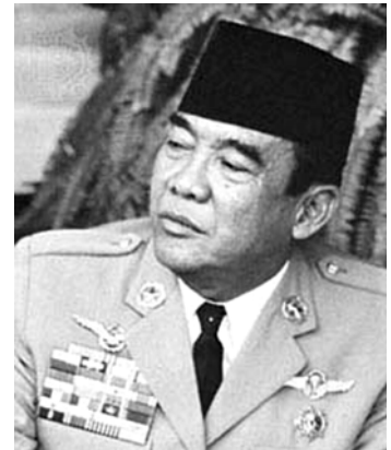
Sukarno, president de la República d'Indonèsia des del 1949 fins al 1967, any en què va ser desposseït del seu càrrec

La conferència de Bandung va reunir vint-i-nou nacions asiàtiques i africanes i va dibuixar els principis i ideals que regien el no-alineament. Els països participants hi van mostrar una forta postura anticolonial i van apostar per fomentar la cooperació econòmica entre els països asiàtics i africans, respectant la sobirania nacional i els drets humans.