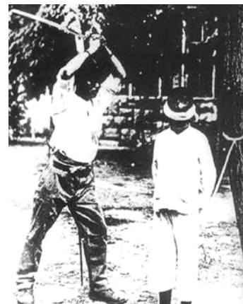
L'actuació brutal dels japonesos amb la població de Nanjing

Encara que el Japó mai no va acceptar negociar amb els representants comunistes o nacionalistes i no va abandonar les seves pretensions d'expansió territorial, l'any 1940 va ser testimoni d'una menor tensió, probablement com a resultat del desgast produït per diversos anys de conflicte armat i d'una atenció més gran a les accions japoneses per part de les potències occidentals.