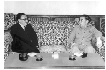
Henry Kissinger i Zhou Enlai, 9 de juliol del 1971, durant el viatge secret que el primer va fer a la Xina

Amb aquests plantejaments de partida i a fi d'obtenir aquests objectius, el llavors assistent de seguretat nacional del president Richard Nixon, Henry Kissinger, va viatjar en secret a la Xina el juliol del 1971 per reunir-se amb el premier Zhou Enlai. En aquesta reunió es van negociar els termes per a la normalització de les relacions entre ambdós països i es va acordar la històrica visita del president nord-americà a Beijing i la seva reunió amb Mao Zedong el febrer del 1972.