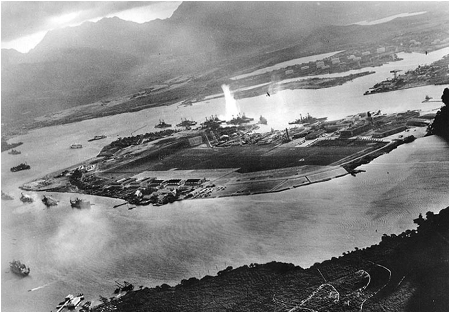
Foto aèria de l'atac a la base de Pearl Harbor

Tanmateix, el factor determinant de l'entrada del Japó a la guerra mundial es va produir el desembre del 1941. Sense prèvia declaració de guerra, l'aviació nipona va atacar per sorpresa la base nord-americana de Pearl Harbor per poc després envair diverses illes i alguns territoris com Hong Kong o la península de Malacca al sud-est asiàtic.