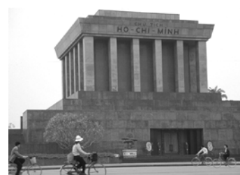
Mausoleu de Ho Chi Minh a Hanoi

Potències com França o la Gran Bretanya van enrolar als seus exèrcits les poblacions dels territoris colonials.