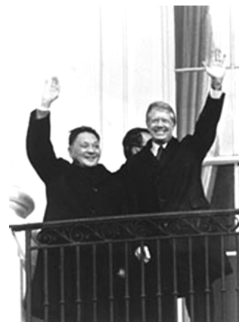
Gener del 1979, el president Carter juntament amb el viceprimer ministre xinès, Deng Xiaoping, al balcó de la Casa Blanca. Deng Xiaoping va ser el primer líder xinès que va visitar els EUA des de la fundació de la República Popular de la Xina el 1949