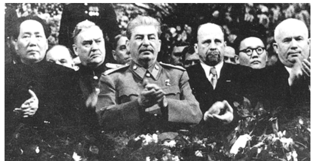
Mao, Bulganin, Stalin i Walter Ulbricht celebrant l'aniversari de Stalin al Kremlin, desembre del 1949

Pel que fa a les relacions bilaterals entre la Xina i l'URSS, la victòria de Mao i el Partit Comunista va ser seguida de la celebració de diverses reunions d'alt nivell que van desembocar en la firma d'un tractat d'aliança entre Beijing i Moscou el 1950. Aquestes accions van donar origen a una aliança que es trencaria definitivament cap al 1969. Els plans de desestalinització i de coexistència pacífica llançats pel successor de Stalin al capdavant de la Secretaria General del Partit Comunista soviètic, Nikita Khrushchev, van obrir una bretxa irreparable entre la Xina i l'URSS que va acabar separant-les durant la major part de la guerra freda.