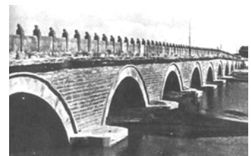
Pont de Marco Polo prop de Beijing