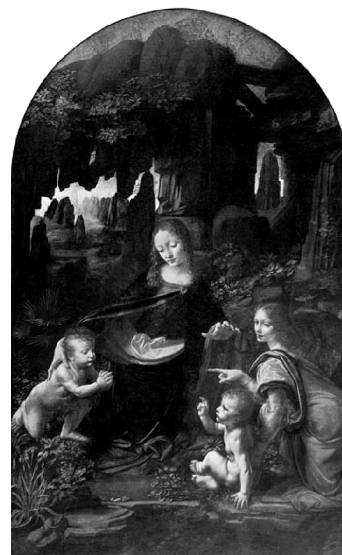
L. da Vinci. La Mare de Déu de les Roques (1483-1486). Oli sobre taula passat a tela, 199 x 122 cm (Museu del Louvre, París, França)