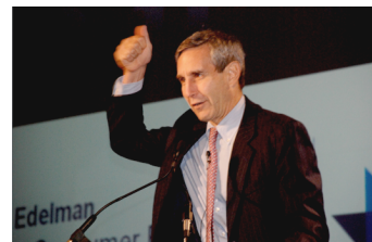
Richard Edelman, president de la consultoria Edelman

El 30 d'octubre de 2008, Richard Edelman, president i conseller delegat de la consultoria que porta el seu cognom, va inaugurar una sèrie de conferències patrocinades per l'Institute for Public Relations a la Universitat de Maryland (University of Maryland's Grunig Lecture Series). En la seva intervenció, titulada "Public engagement: the evolution of public relations" ("Compromís amb el públic: l'evolució de les relacions públiques"), Edelman va dibuixar amb mà mestra l'escenari actual en què es mou la disciplina de les relacions públiques.