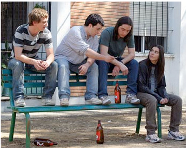
Fotograma de Déjate caer de Jesús Ponce (2007).

Aquest xoc assegura el conflicte amb el món adult, els pares i els educadors de les escoles i els instituts. Desenganyat, el jove crida i demana que "no el ratllin ". En el cas dels pares, perquè l'enfonsament del suport familiar o la mateixa crisi sentimental fan que la pèrdua de confiança s'encasti en l'ànim convivencial dels joves. En el cas de l'escola, perquè el naufragi de les expectatives escolars, el fracàs en algunes assignatures i el bombardeig diari i reiteratiu que forma part de la repressió acadèmica cristal·litza en la desmotivació i múltiples formes d'apatia i renúncia.