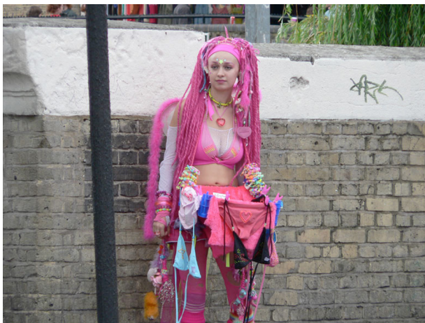
Parroquiana de Camden Town (Londres).

No podem defensar, però, que la condició juvenil impliqui ser membre d'una cultura comuna. La cultura juvenil no és uniforme ni evident per si mateixa; tanmateix, a través d'ella podem comprovar com el sistema de consum permet als joves salvar la seva condició intersticial i redimir en el pla simbòlic les seves incerteses i, per descomptat, els seus fracassos en el pla de la lluita per la promoció social i pel gaudi d'un món fet d'objectes cobejables (Delgado, 2002).