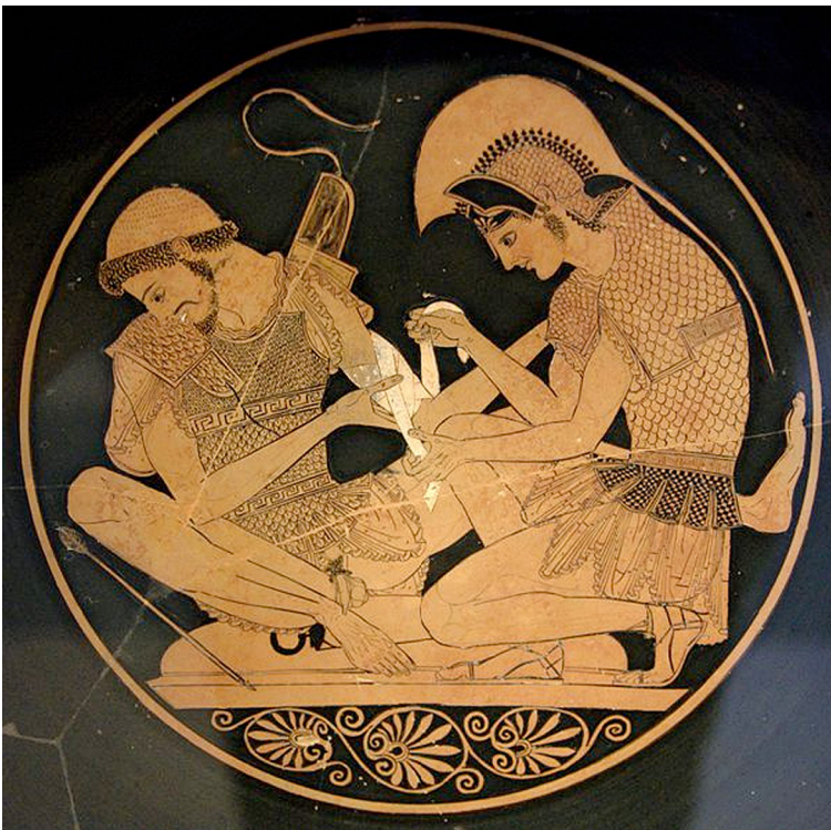
Aquil·les embenant el braç ferit de Patrocle. Un exemple de companyonia lloat per Homer.

Els grecs, per exemple, es preocupaven de l'educació dels joves mitjançant la seva paideia amb l'objectiu de satisfer els ideals de la polis . Diferents filòsofs i educadors competien entre ells per a forjar la joventut més valuosa del seu temps. Ho feien des d'institucions educatives en les quals es cultivava la companyonia , l'exemple de l'adult i la companyia dels iguals, elements bàsics de la paideia grega.