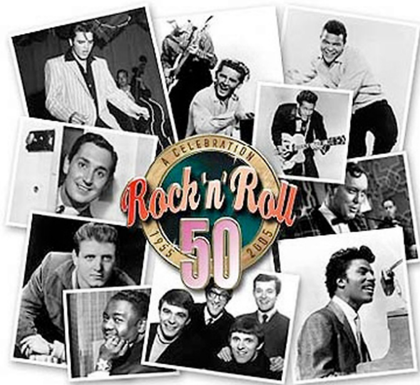
Coberta del CD recopilatori A celebration Rock'n'Roll 50 .

de les obres més venudes de la història del rock'n'roll i va fer palès que els nous herois musicals s'unien als cinematogràfics perquè els joves dels anys cinquanta tinguessin models en els quals reconèixer-se i identificar-se.