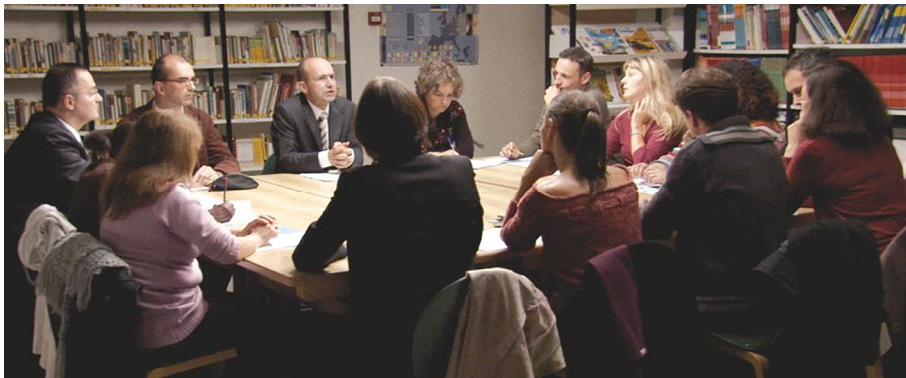
Fotograma d' Entre les murs (La classe) .

En el debat de l'educació dels últims trenta anys hem assistit a intercanvis confosos, sovint visceralment. D'una banda, els partidaris dels coneixements, de l'altra, els de la pedagogia. Cada vegada les posicions estan més confrontades i, tanmateix, la realitat demana l'entesa, un punt d'unió.