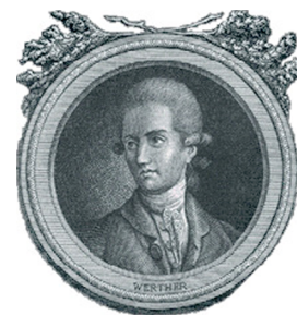
Retrat de Werther.

El destí final de Werther, que es dispara un tret amb la pistola del promès de Charlotte, la jove que no pot correspondre el seu amor, el converteix, per a molts autors, en el primer jove de la història. I és que una generació sencera es va reconèixer en el dolor del jove Werther. S'imitava la seva manera de vestir, els joves consideraven de bon to perfumar-se amb Eau de Werther i decoraven les seves habitacions amb Werther nippes , figuretes, gerros de flors, àmfores de porcellana amb motius wertherians. Però el pitjor: també imitaven la resolució final del protagonista.