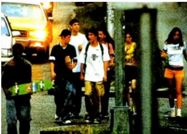
Fotograma de Kids de Larry Clark (1995).