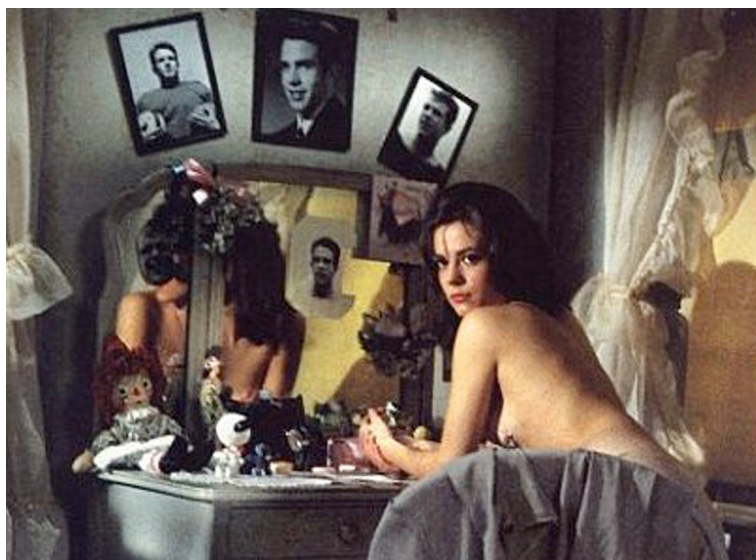
Natalie Wood a Esplendor a l'herba en un moment en què és capaç de manifestar el seu veritable desig. Acabarà essent víctima de la repressió sexual de l'època.

Tanmateix, si alguna cosa distingeix la joventut és la seva característica liminar, el fet de situar-se entre els marges de la dependència infantil i l'autonomia dels adults, en el període de canvis en què es compleixen, envoltades de certa torbació, les promeses de l'adolescència, en els confins encara imprecisos de la immaduresa sexual, de la formació de les facultats intel·lectuals i del seu floriment, de l'oposició i l'absència d'autoritat a l'adquisició progressiva de poders. Però més que una evolució fisiològica concreta –tal com subratllen Levi i Schmitt (1996) en la introducció de la seva Historia de los jóvenes –, la joventut depèn d'unes determinacions culturals que difereixen segons les societats humanes i les èpoques, i cadascuna d'elles imposa a la seva manera un ordre i un sentit al que sembla transitori i, fins i tot, caòtic i desordenat. Carles Feixa, un dels referents de l'antropologia de la joventut del nostre país, ho expressa de la manera següent: