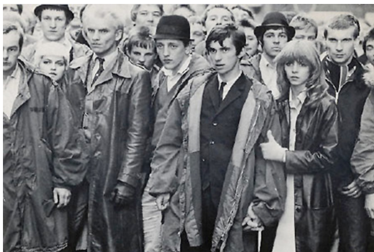
Fotograma de Quadrophenia .