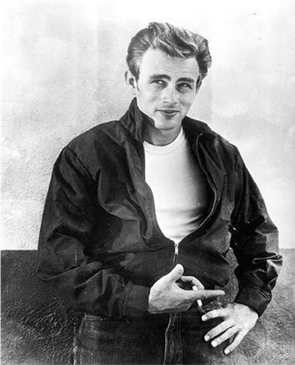
James Dean en una foto de promoció de la pel·lícula.

Tots aquests ingredients van fer que la pel·lícula de Nicholas Ray es convertís en un clàssic de la cultura popular nord-americana. El que mostra la pel·lícula, sobretot pel que fa a la seva aproximació a la soledat de l'adolescent, va consolidar la imatge de la ruptura generacional i les noves formes de vida dels joves. La cultura juvenil pròpiament dita havia nascut i ho va fer per a oferir als joves un món autònom i ple de sentit que no tindria res a veure amb el món adult, incapaç de donar les respostes adequades a les noves generacions.