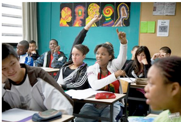
Fotograma d' Entre les murs (La classe) .

també l'autor de la novel·la). El film Entre les murs (La classe) va ser guardonat amb la Palma d'Or a Cannes l'any 2008.