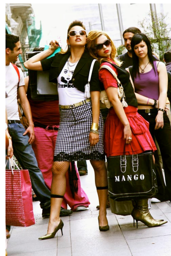
Yo soy la Juani de Bigas Luna (2006).