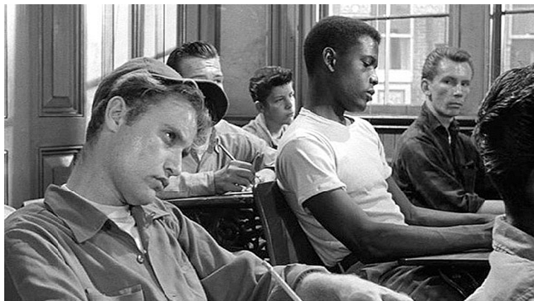
Fotograma de La jungla de les pissarres .

La jungla de les pissarres mostra el conflicte de Dadierno (Glenn Ford), el mestre idealista, amb la seva classe de l'institut, violenta i alhora indiferent. Al contrari que els seus resignats col·legues, Dadierno es deixa portar pel desànim quan és agredit per un grup d'alumnes, ni quan la mestra nova quasi és violada o la seva dona embarassada pateix un atac de nervis a causa de les cartes i trucades calumnioses que reben a casa. Dadierno renuncia fins que aconsegueix trencar la unitat dels estudiants i aparta West (Vic Morrow), el líder negatiu i rebel, per a col·locar en el seu lloc Miller (Sidney Poitier).