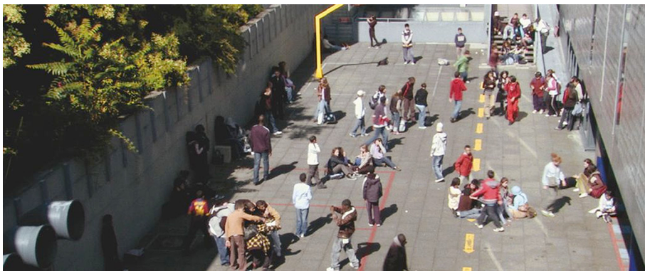
Fotograma d' Entre les murs (La classe) .

Una disciplina com l'antropologia permet que la pedagogia continuï mantenint un discurs reduccionista entorn de la joventut. Fer un esforç per a conèixer i comprendre les noves generacions ens ha de servir per a connectar-hi, interessar-nos per cadascun dels subjectes amb els quals treballem i construir, així, ponts amb el món, l'actualitat i les exigències socioculturals del nostre temps. Cal assumir la força educativa de la cultura juvenil viva, en termes de Paul Willis (1998), si no volem convertir els centres educatius en espais tancats en si mateixos i aïllats de tot el que els envolta.