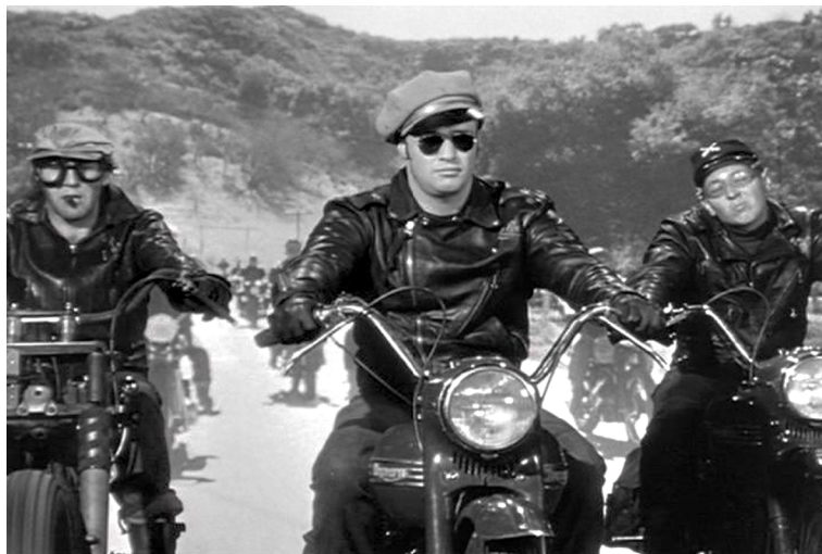
Fotograma d' El salvatge .

Una altra pel·lícula de referència que abordaria la problemàtica juvenil, la va dirigir Richard Brooks (1955) i es va titular La jungla de les pissarres ( Blackboard jungle ). Aquest cop el conflicte es produeix en l'àmbit institucional i destapa les contradiccions que, encara avui, es continuen repetint a les aules.