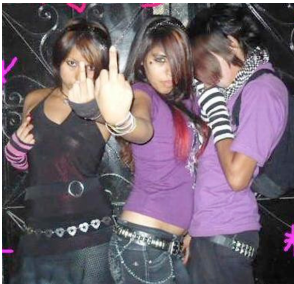
Emos en actitud provocativa.

Les varietats en els estils i les mobilitzacions estètiques dels joves són tan nombroses com difícils d'identificar (Feixa, 2004). Tota la seva expressivitat sembla destinada a argumentar el que Patrice Bollon (1992) ha interpretat com una rebel·lió basada en la màscara. Una rebel·lió sense pretensions reivindicatives, que no planteja impulsar cap moviment social encapçalat per joves com va succeir als anys seixanta (Rivière, 2002). Simplement, pretenen visibilitzar una identitat, ser distingits, assumir algun tipus de jerarquia, a falta de poder real, en l'entramat anònim de l'espai social.