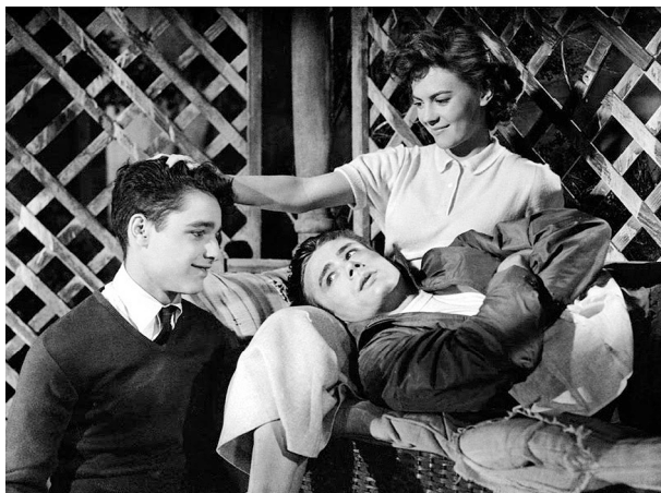
Fotograma de Rebel sense causa .

El desarrelament, la soledat, l'exili interior... formen part del ritual de pas de l'adolescència a la maduresa adulta que Nicholas Ray va narrar a Rebel sense causa , fent transcórrer l'acció de la pel·lícula en un matí i una nit de la vida d'un grup de joves.