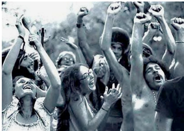
Joves hipies en el festival de Woodstock (1969).

Els desajustos generacionals dels anys seixanta van anar configurant una cultura juvenil pròpia que es plantejava la recerca de la identitat com la seva tasca principal. Molts joves van assumir aquesta recerca com una reivindicació permanent que els feia entrar en conflicte amb la generació adulta (Mendel, 1970) i que els va dur a protagonitzar un seguit d'esdeveniments que van convertir l'època en un autèntic període contracultural (Roszack, 1968). La joventut es va manifestar, doncs, com una etapa substantiva, com la generació immediata del recanvi social, i va inaugurar un nou estadi cultural i la condició postmoderna del subjecte contemporani.