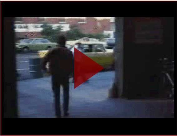
Taxi driver , de Martin Scorsese