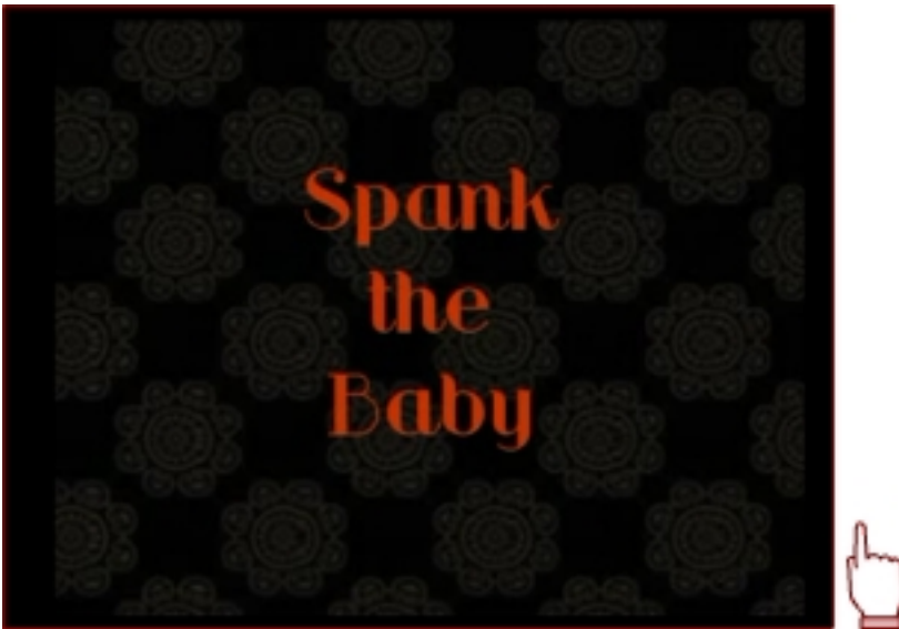
Spank the baby , d'Albert Mundet

Vegeu també el guió tècnic del videoclip Spank the baby .