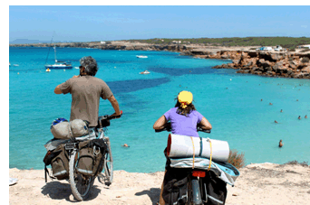
Una coartada per a ensenyar; el cicloturisme n'és l'excusa.

Tota una bateria de pretextos perquè l'educador/a social pugui fer múltiples ensenyaments i vincular-los a objectius generals de la mesura orientada pel jutjat de menors establerts en els seus projectes educatius individualitzats. Activitat que connecta amb interessos i desitjos que reactiven qualsevol procés educatiu; en el nostre cas, projectes de llibertats vigilades, prestacions en benefici de la comunitat i tasques socioeducatives que tracten de restituir drets i possibilitats de participació en les diferents cartografies de béns i espais.