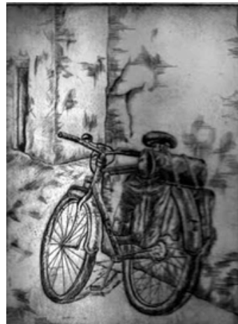
Viatjar i aprendre amb una bicicleta amb les alforques plenes de continguts

(15) En el nostre cas, donen compte de les finalitats perseguides en les mesures de llibertat vigilada i tasques socioeducatives.