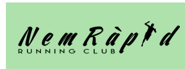
Fons de color no corporatiu clar