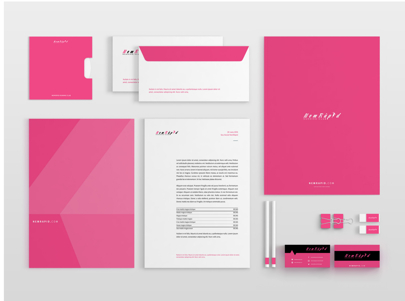
Aplicació de la marca NemRàpid en la papereria corporativa.