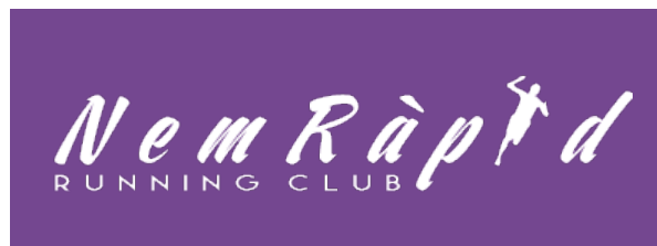
Fons de color no corporatiu fosc