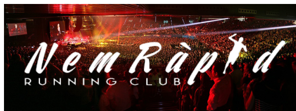
Fons fotogràfic fosc