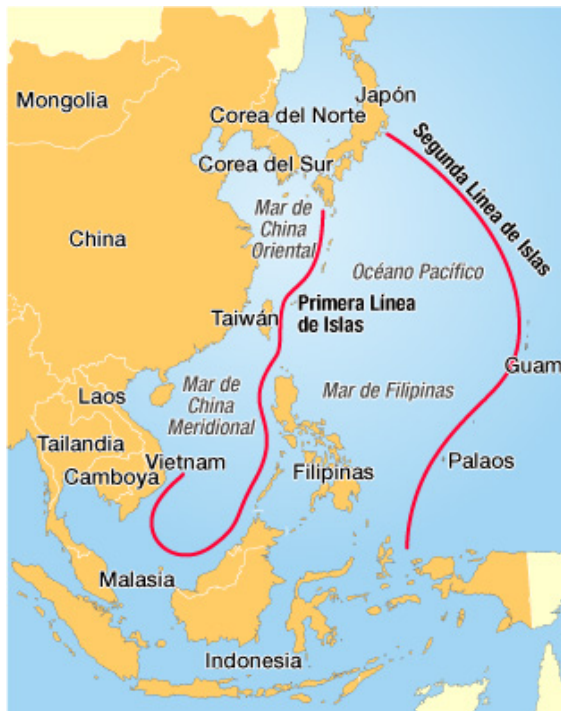
Fig. 1- Mapa de la Primera y Segunda Cadena de Islas que desea crear la armada china.