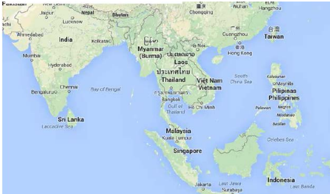
Fig. 1- Ubicación del Mar de China, y conexión con el Océano Índico y Pacífico.

último, otro factor importante de dicho mar, es su riqueza en hidrocarburos y pesca (Carrasco 2007). De ahí, el inusitado interés por controlarlo, tanto antaño como ahora.