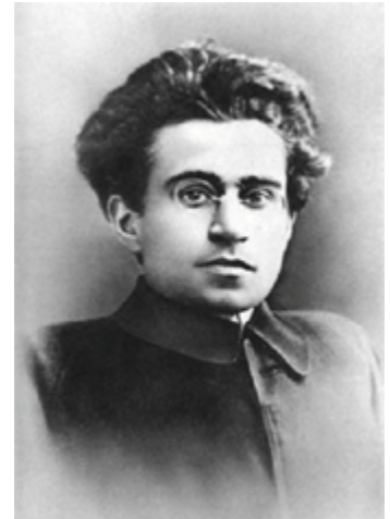
Antonio Gramsci (1891-1937)

Gramsci argumenta que precisament aquestes creences i sabers són els que serveixen per a dominar la classe treballadora que ha assumit com a veritats idees que es poden debatre perfectament. Per aquesta raó, perquè les revolucions funcionin han de poder no tan sols transformar les relacions de producció sinó també generar noves certeses, tradicions i valors culturals a fi de poder escapar de la influència del poder cultural hegemònic.