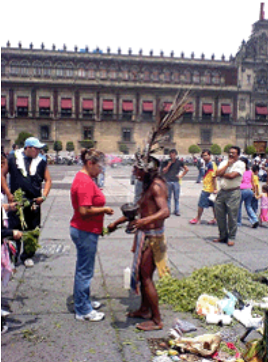
Foto de la Plaça del Zócalo, Mèxic DF

D'aquesta manera, Canclini argumenta que la cultura llatinoamericana tendeix a la hibridació d'aquestes cultures, temps i vides diferents.