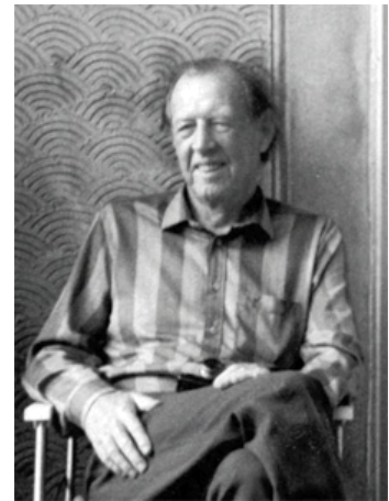
Raymond Williams (1921-1988)