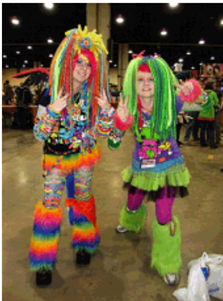
Foto de dos ravers

Amb aquest treball, Thornton s'allunya de la visió clàssica de les subcultures que tenien les primeres generacions de Birmingham, atès que ja no les analitza com a moviments polítics o de mecanismes per a garantir agència sinó com a dispositius econòmics . Les subcultures estan plenament integrades en l'economia i, com demostra aquesta autora, poden ser mitjans excel·lents per a generar diners.