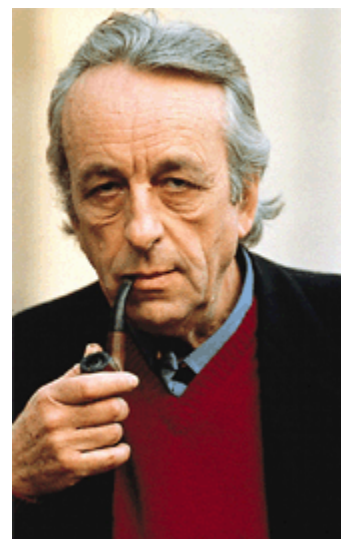
Louis Althusser (1918 - 1990)

El treball d'Adorno i Horkheimer es tracta en el mòdul "Sociologia de la cultura" d'aquest material didàctic.