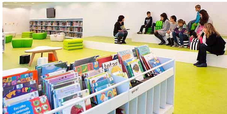
Activitat de lectura a l'àrea infantil