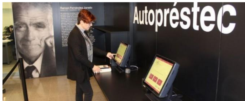
Servei d'autopréstec a la Biblioteca Ramón Fernández Jurado

Pel que fa a l'aspecte tecnològic, al ser una instal·lació cultural de construcció tant recent aquest espai compta amb totes les innovacions tecnològiques necessàries per treballar en l'entorn digital i per fer-ho sense renunciar als suports tradicionals. Disposa d'ordinadors, impressores, internet i WIFI, així com la possibilitat d'obtenir el certificat ACTIC. 34 Cal destacar la seva excel·lent pàgina web, on és possible consultar el fons i les activitats, fer tràmits en línia, descarregar documents, accedir a les principals xarxes socials, etc. També cal destacar l'extens fons de recursos virtuals en línia de totes les Biblioteques Municipals de la província de Barcelona, el servei d'autopréstec informatitzat, el servei eBiblio de préstec de llibres electrònics i la col·lecció local d' E-books , una nova eina cultural que posa a disposició dels usuaris la col·lecció de llibres que s'han editat o en els que ha col·laborat la Àrea de Cultura de l'Ajuntament de Castelldefels, disponibles en PDF d'alta resolució.