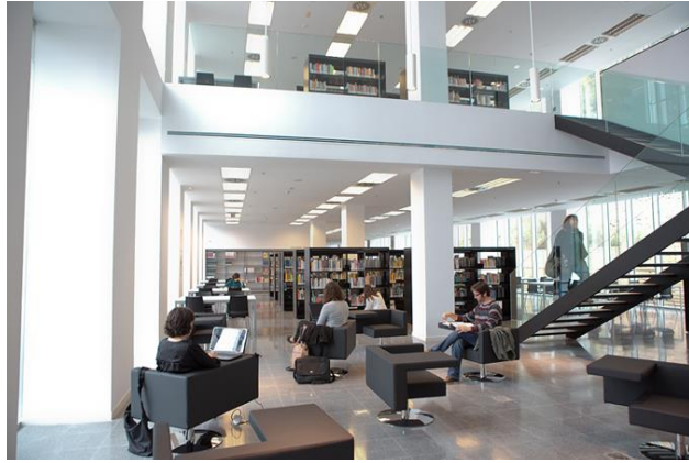
Espai de la Biblioteca Ramón Fernández Jurado