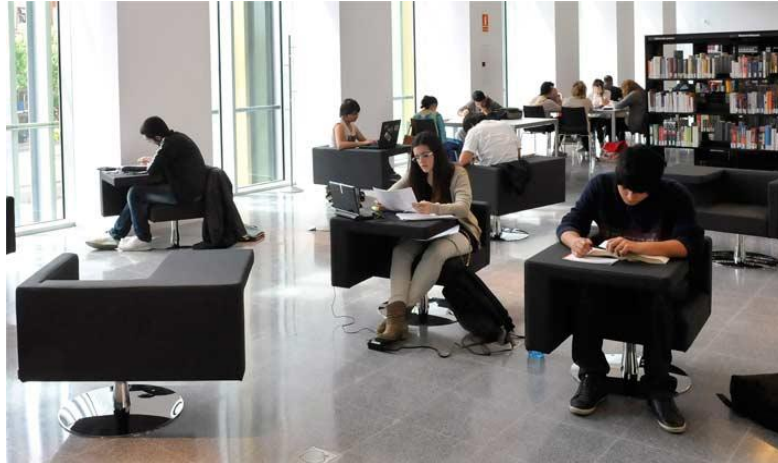
Espai de la Biblioteca Ramón Fernández Jurado

Pel que fa a l'aspecte social, la BRFJ és un bon exemple d'allò que plantejàvem anteriorment: un espai que ha aconseguit convertir-se en un gran centre d'activitat sociocultural perfectament integrat en l'entorn social on s'ubica. En aquest equipament podem trobar activitats de foment de la lectura, activitats infantils i familiars d'allò més variat, ensenyament de les noves tecnologies de la informació i la comunicació, gestió de la multiculturalitat, enfortiment de la cohesió social mitjançant activitats obertes a tothom i adaptades a tota mena de públics, col·laboració en la integració laboral de la ciutadania, espais per la música i el cinema, etc. Tanmateix, cal destacar especialment l'establiment de lligams de col·laboració amb altres entitats culturals i d'oci de la ciutat o d'altres llocs; en algunes de les activitats proposades hem trobat la col·laboració amb institucions culturals diverses d'abast municipal o regional (Institució de les Lletres Catalanes, Parc Agrari del Baix Llobregat, Associació Cultural La Muntanyeta, Escola Municipal de Dansa, Instituto de Ciencias Fotónicas ICFO, KIDS&US school of english , etc.), d'empreses o comerços locals (Corporestudio, Celler Vallès, Osteofels, etc.) o empreses i entitats de més abast (YoungLiving aromateràpia, Més que Verd cuina saludable, Mètode Bates de educació visual, etc.).