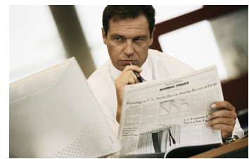
La capacitat d'innovació empresarial és un dels pilars de l'economia del coneixement.

Actualment disposem d'unes tecnologies que no tan sols substitueixen el treball manual, sinó que també ajuden, i en alguns casos substitueixen, l'home en el procés generador de saber (o treball mental). Per tant, l'anàlisi de les TIC ens condueix naturalment a l'estudi econòmic del coneixement, com a recurs o com a mercaderia. Això no vol pas dir que l'activitat econòmica no hagi disposat mai del coneixement entre els seus recursos. Al contrari. Els exemples de l'empresari innovador o del capital humà ens ho desmenteixen. Ara bé, actualment podem parlar d' economia del coneixement perquè disposem d'unes tecnologies que situen el coneixement i la capacitat d'aprenentatge (i oblit) dels agents econòmics al centre de l'escenari del desenvolupament capitalista.