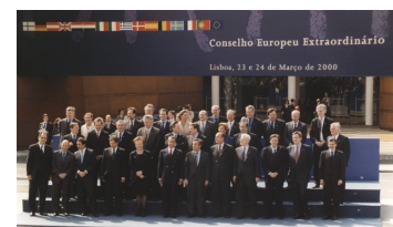
La Unió Europea, en el marc de la construcció d'una societat del coneixement, es va plantejar ser l'àrea econòmica més competitiva del món el 2010. Per això, va crear el programa eEurope, a partir del qual s'ha desenvolupat una política econòmica del coneixement. Tot i amb això, els resultats d'aquesta política han estat més aviat discrets i la Unió Europea en el seu conjunt encara dista molt de ser una economia del coneixement. A la foto, el Consell Europeu de Lisboa a Portugal organitzat els dies 23 i 24 de març de 2000.

1) Una política de generació de coneixement. És a dir, un impuls directe a tot tipus de formació, amb l'objectiu d'augmentar la dotació econòmica de coneixement tàcit i explícit. Un segon element, que complementa el primer i que també cal destacar, és l'impuls a la recerca i al desenvolupament , i la posada en marxa de tot tipus de mecanismes de foment de la innovació.