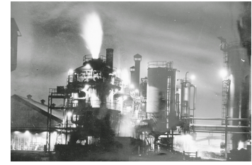
Les innovacions en la indústria petroquímica en els anys vint van representar un nou sistema tecnològic.

Són “canvis tecnològics –o constel·lacions d'innovació– de gran abast, que afecten un conjunt important de branques d'una economia i que poden generar l'aparició de noves branques d'activitat.”