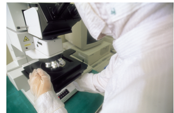
La investigació científica, sovint, s'acaba transformant en innovacions radicals.