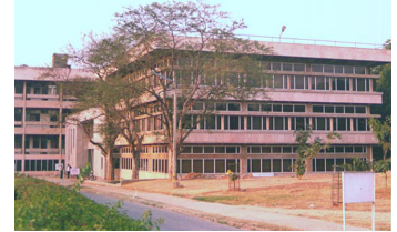
Laboratori de recerca d'IBM a Delhi

Aquests canvis tècnics i productius es combinen amb profundes alteracions polítiques i institucionals , com la necessitat de plantejar polítiques globals per a satisfer necessitats globals, i també transformacions socials i culturals de primera magnitud , com la incorporació progressiva del coneixement en l'explicació dels augments de productivitat i competitivitat, els nous requeriments de formació, la incorporació massiva de la dona al mercat de treball,