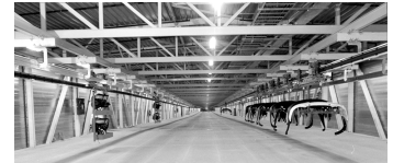
El disseny organitzatiu de l'activitat empresarial tendeix a la relocalització en xarxa.

Avui, el procés de mundialització ens aboca a estratègies competitives basades en la innovació, perquè altres estratègies com, per exemple, la de salaris baixos, ja no són plantejables en una estratègia de competitivitat a llarg termini. Així, la innovació és l'element clau en la definició d'una estratègia de guanys de productivitat i com a instrument de diferenciació del producte i de guany de la quota de mercat.