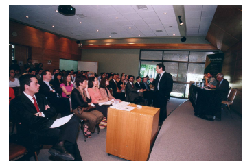
L'aplicació productiva de les TIC transforma les habilitats a desenvolupar en el treball.

Per coneixement , i des del punt de vista econòmic, entenem l'acció humana i dinàmica de conèixer. Aquesta aproximació ens permet d'aproximar-nos als quatre tipus de saber que caracteritzen el coneixement com a recurs econòmic. Hi ha coneixements que són fàcilment reproduïbles, la qual cosa ens de-