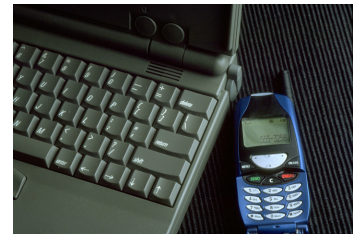
Les TIC fan observable la generació de coneixement.

2) I segona, perquè, com veurem més endavant, les TIC incideixen directament en la creació de coneixement .