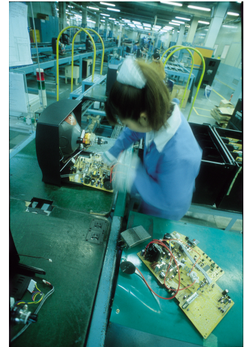
Les innovacions incrementals provenen de l'aplicació i millora de la producció.

Acaben conduint l'economia cap a un canvi estructural, si bé el seu efecte macroeconòmic és relativament reduït i localitzat, si no és que un conjunt d'innovacions radicals es vincula amb l'ascens de noves indústries i serveis com, per exemple, la indústria de materials sintètics o de semiconductors.