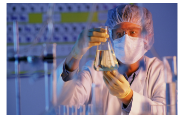
La innovació: element clau de la nova economia global del coneixement