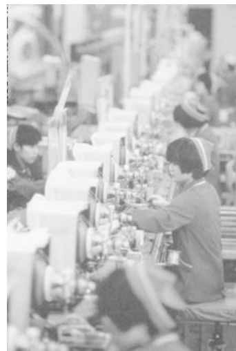
Taller d'alta tecnologia

En resum, podem afirmar que les tecnologies del processament de la informació i la comunicació han esdevingut la base d'una revolució tecnològica de gran abast i penetració, que incideixen, d'una manera o d'una altra, en totes les facetes de l'activitat humana.