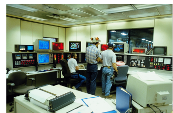
Les TIC són el nucli d'un procés de transformació econòmica de primera magnitud.

b) Segon, un nou esquema en la producció de coneixement. És a dir, l'aplicació massiva a l' activitat econòmica del coneixement vinculat amb les TIC .