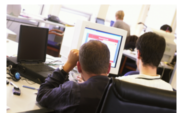
Els canvis tècnics comporten nous requeriments de formació.