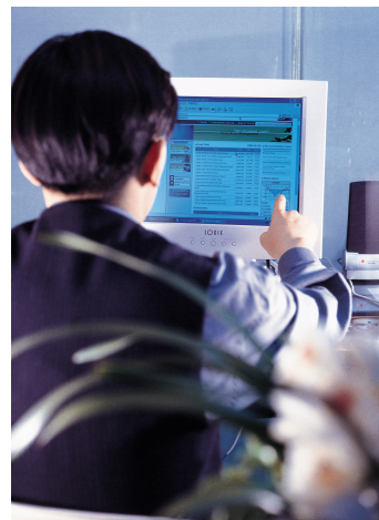
Cursos d'autoaprenentatge virtual: la Xarxa permet de trencar les limitacions de temps i espai.

Ja sabem que la nova economia situa el coneixement i el treball flexible al centre de l'escenari del creixement i el desenvolupament econòmic. Però també hem dit que les habilitats i capacitats que requereix el mercat de treball s'han modificat, amb l'aparició de nous requeriments que cal desenvolupar. Això ens porta, inevitablement, a un replantejament dels mecanismes de formació tradicionals .