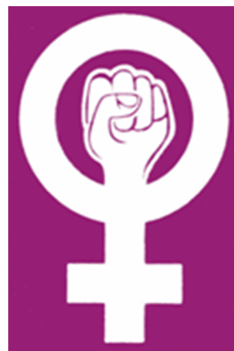
Les feministes van crear un nou univers simbòlic. C.P.

“Denunciamos como consecuencia del poder paternalista, el mito de la virginidad en la que se asienta la legitimidad de los hijos, el mito de la maternidad como esencia de la conducta femenina y todos los otros mitos que han estado elaborados en torno a las mujeres.”