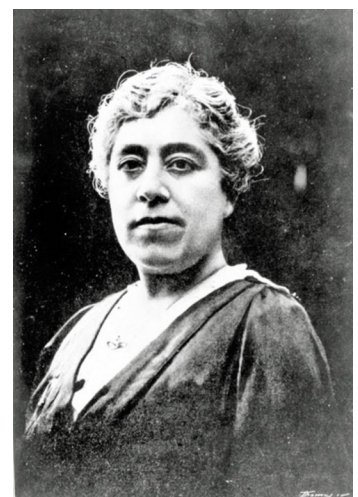
Caterina Albert/Víctor Català.

Durant generacions les dones havien internalitzat codis diferencials de gènere que els adjudicava un rol limitat a la llar. Malgrat l'impacte que va tenir, moltes dones expressaven expectatives que anaven molt més enllà dels convencionalismes socials i desafiaven els rols de gènere tan restrictius.