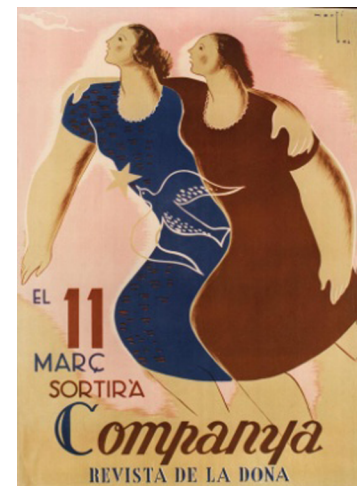
I. G. Viladot. “Companya. Revista de la Dona”. Cartell (100 x 68 cm). Biblioteca Pavelló de la República (UB)

Al mateix temps, el Govern català va promoure programes de formació professional femenina per facilitar la seva integració en el mercat laboral. El juliol de 1937 la Generalitat va crear l' Institut d'Adaptació Professional de la Dona (IAPD) . Si bé reflectia la preocupació d'evitar la paralització de la indústria