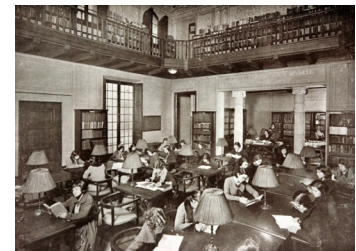
Sala de lectura de la biblioteca de l’Institut de Cultura i Biblioteca Popular per a la Dona, el 1931. C.P.

Des que es va fundar fins al 1936, l’ICBPD es va dedicar a l’educació i la formació professional de les joves de la mitjana i petita burgesia i de la classe treballadora i va aconseguir una educació i formació professionals d’excel·lència en un context de lamentables dèficits en aquests àmbits. Durant els vint-i-set anys d’existència va exercir una tasca rigorosa que se sostenia en un cos de professorat de l’elit professional que impartia una docència científica, moderna i de gran qualitat en les nombroses alumnes i associades, moltes d’elles dotades de