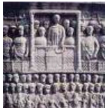
Obelisco de Teodosio

La antigüedad en la Península Ibérica está marcada a efectos ceremoniales por las distintas culturas hegemónicas que se van sucediendo en ella, ya que es un territorio que no goza aún de unidad propia. El reino o confederación de Tartessos, cultura autóctona que surge en torno a la desembocadura del Guadalquivir, debió de tener importantes manifestaciones ceremoniales si nos atenemos a los restos arqueológicos que nos han quedado, como el Tesoro del Carambolo. La Dama de Baza es otro de los ejemplos que podemos citar de lo que debió de suponer el riquísimo ceremonial ibérico. Por lo que se refie-