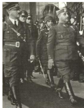
El encuentro entre Hitler y Franco en Hendaya

Paralelamente hemos de constatar que el protocolo, a diferencia del ceremonial, aparece en sociedades avanzadas culturalmente que necesitan ordenar la presencia del Estado en aras de la transmisión de conceptos como sus jerar-