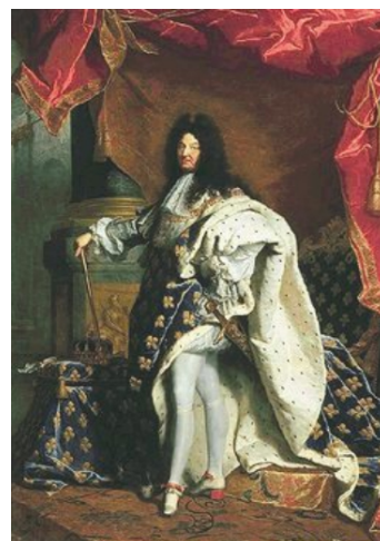
Luis XIV (1643-1715)