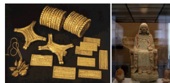
Tesoro del Carambolo (siglos VIII-III a. C.) y Dama de Baza (400 a. C.)