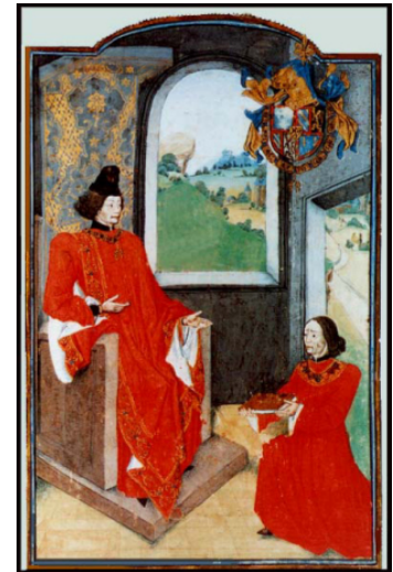
Jean Lefèvre, rey de armas Toisón de Oro, entregando el Libro de Estatutos a Felipe el Bueno (La Abadía, Koninklijke Bibliotheek, Ms. 76 E 10, fol. 28r).

Felipe III el Bueno, duque de Borgoña (1419-1467), creador del denominado "uso o manera de Borgoña", impone unas rígidas normas de ceremonial para convertir su corte en el modelo de etiqueta y orden que dio pie a que en ella se utilizara por primera vez un tenedor. Aunque la corte de Borgoña nunca fue una primera potencia política o militar de la época, sí fue la más influyente en ceremonial y etiqueta. Pretendía así superar en fastos a otras cortes europeas y contrarrestar su poder político-militar rodeando al soberano de un ritual que afirmase su superioridad sobre sus súbditos, imponer una regla y un orden rigurosos a las actividades de la corte y los palacios ante los continuos cambios de sede de los duques, y homologar un mosaico de territorios cohesionándolos por medio del ceremonial. Para ello, trajo a su servicio a los nobles de todos estos territorios, manteniéndolos unidos por la Orden del Toisón de Oro como aliados en torno a una causa común.