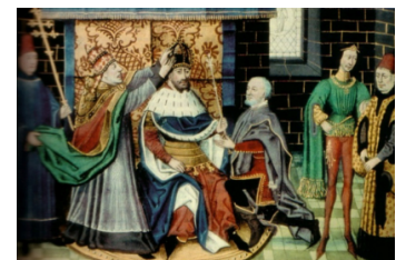
Carlomagno coronado emperador (800)

Cuando Carlomagno llega al poder, el reino de los francos debía desarrollar sus instituciones administrativas, culturales y jurídicas, sin ni siquiera disponer de una residencia permanente, ya que los reyes francos aprovechaban el verano para gobernar sus territorios viajando por ellos en sus campañas militares, y durante el invierno vivían en cualquiera de sus palacios.