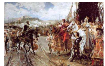
La ceremonia de la entrega de Granada (1492)

El primer contacto de España con la etiqueta borgoñona se produjo cuando la princesa Margarita vino para casarse con el príncipe D. Juan (1474), en el banquete ofrecido por Felipe el Hermoso a los Reyes Católicos y a su esposa Doña Juana en Toledo. La gran novedad consistió en que la comida fue servida según los cánones del ceremonial borgoñón, de ritmo cadencioso y reglamentado hasta el más mínimo detalle, con un servidor para cada comensal para la comida y la bebida, hecho que produjo gran impresión a los castellanos, acostumbrados a comer entre tumultos, ruido y desorden.