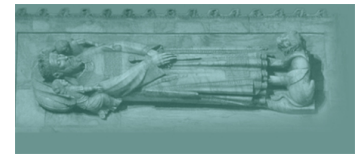
Sepulcro de Pedro IV (1319-1387) en el Monasterio de Poblet

El reino aragonés, por el contrario, ha sido considerado una potencia europea mediterránea en la que existía un ceremonial determinado y que estaba reglamentada por una normativa detallada. Pedro el Ceremonioso (1336-1387), hace aplicar las Ordenacions fetes per lo Molt Alt Senyor en Pere Terç Rey d'Aragó, sobre lo Regiment de tots los officials de la sua Cort , para reglamentar todos los movimientos de su corte, especialmente las funciones de los cortesanos. Fijó el juramento de los reyes y fue el constructor de las tumbas reales del Monasterio de Poblet, otorgando en 1344 el Ordenamiento de Casas Reales y Cancillerías .