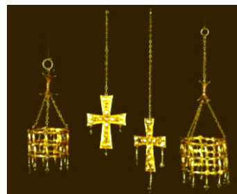
Tesoro de Guarrazar y Corona de Recesvinto (484-711)

Los tres grandes centros de poder de la época son Córdoba, Granada y Sevilla, y en los tres encontramos testimonios fehacientes de las dimensiones de la vida pública de sus soberanos, que toman conciencia de la necesidad de estar revestidos de una serie de símbolos para hacer visible su poder, principalmente los títulos (emir, califa, príncipe de los creyentes o noble rey). Así se evidencia en la investidura, que se realiza siguiendo el modelo oriental, en los signos de soberanía (la corona o el turbante, el trono, el cetro o báculo de bambú, el parasol o sombrilla a modo de palio y el sello real), así como en la ostentación y el lujo o las funciones ceremoniales (presidir la oración solemne del viernes, conceder audiencia pública a sus súbditos o a enviados especiales, etc.).