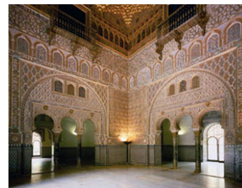
Patio de Embajadores en el Alcázar de Sevilla

La magnificencia de palacios como la Alambra de Granada o el Alcázar de Sevilla ejemplifican esta tendencia a la perfección. A su vez, Medina al-Zahra, la ciudad-palacio mandada construir por Abd-al-Rahman III, constituye un espléndido centro cortesano regido por una rígida normativa ceremonial. Entre las visitas diplomáticas conocidas es de destacar la embajada de Constantino VII a Abd-al-Rahmán III (949), en la que cabe subrayar el asombro de los emisarios de Bizancio –más que habituados al ceremonial y a la solemnidad– ante el esplendor del pomposo aparato desplegado ante sus ojos. Ibn Jaldún nos da noticia de las visitas de emisarios de los reyes francos y alemanes, e incluso de la del emperador Otón I de Alemania.