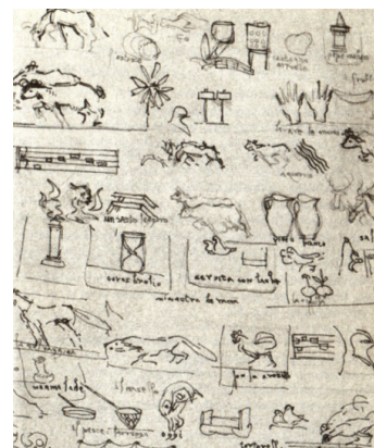
Menú dibujado por Leonardo y Boticelli

Paralelamente a estos procesos desarrollados en los centros de poder, la propia dinámica social va imponiendo un refinamiento en las costumbres que empieza a apreciarse en los ambientes más destacados del Renacimiento italiano y francés (las cortes, principalmente). Autores como Castiglione (1994) o Maquiavelo (1994) escriben sobre las maneras de comportarse o gobernar, y el mismo Leonardo da Vinci (1996) desarrolla una importante labor como maestro de ceremonias en la corte milanesa de Ludovico el Moro, inventando la servilleta o creando la nouvelle cuisine en su taberna de Florencia junto con Boticelli.