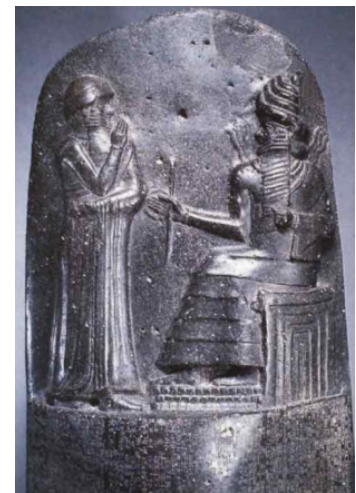
Código de Hammurabi

La obra maestra de la época de todo este universo ceremonial es la Estela de Hammurabi (1793-1749 a. C.), el primer código jurídico conocido, donde se aprecia cómo el soberano comparece ante el dios Shamash sentado en su trono para que éste le entregue los atributos del poder.