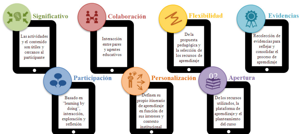
Fig. 2: Características del curso PREA