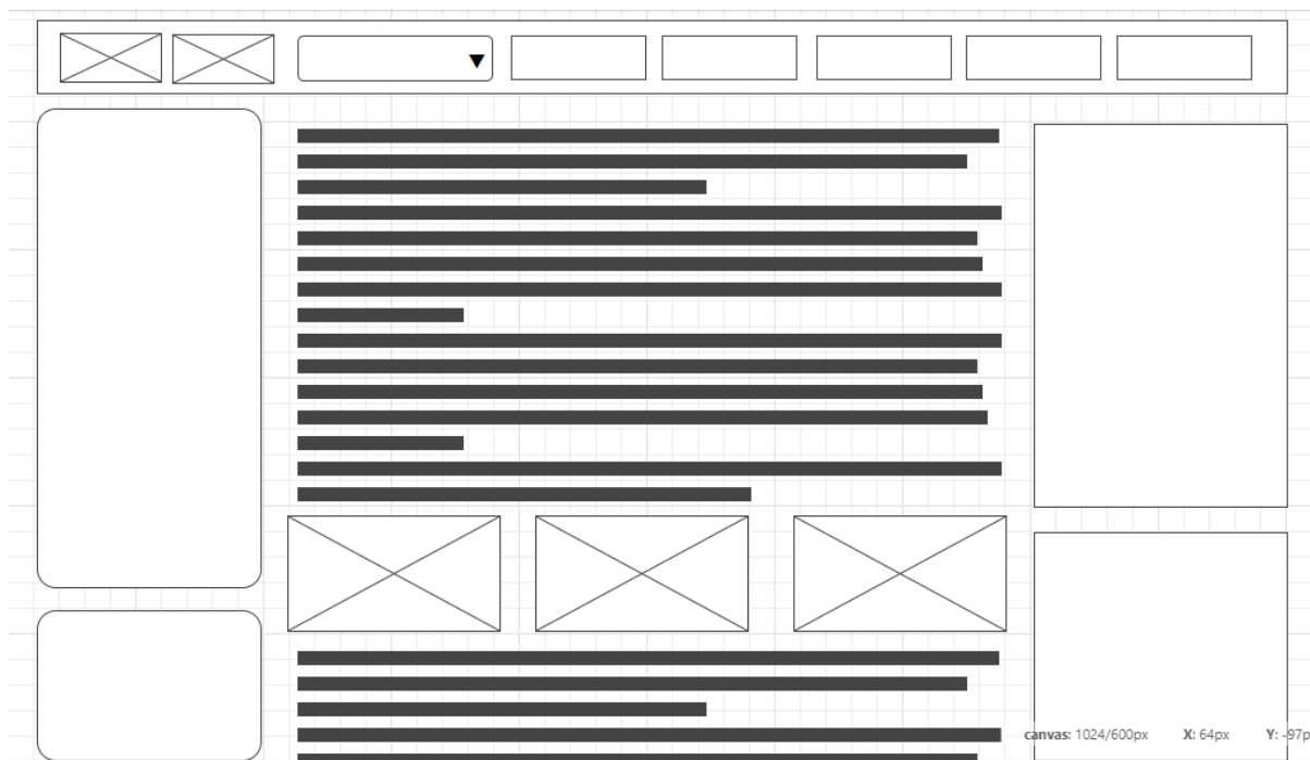
Figura 2: Wireframe del nou aspecte de la portada de la pàgina web futboldesdefrancia.com

El wireframe de la pàgina principal per redefinir en un principi i la base a seguir en les següents pàgines sempre que els complements així ho permetin i l'aplicació de Wordpress també ho permeti seguirà la línia següent, tot i que sempre pot estar subjecte a canvis que el client estimi oportunament.