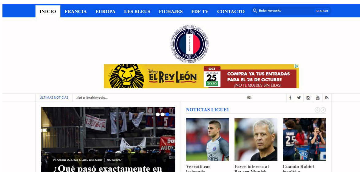
Figura 1: Portada de la pàgina web futboldefrancia.com

Posteriorment, presentar una proposta d'actualització del disseny al client i que valori si les solucions aportades són les correctes i són del gust del mateix. Posteriorment si el client accepta les condicions que hem aportat en la proposta, es realitzarà un nou prototip de la pàgina amb un nou disseny, aportant les millores presentades i tenint en compte com havíem puntualitzat anteriorment, els punts forts del mateix lloc web.