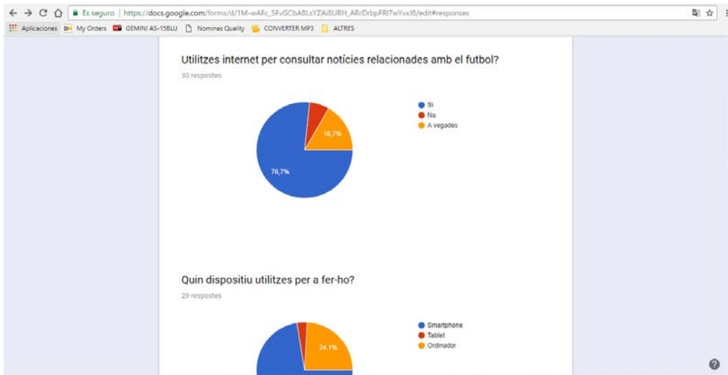
Captura de pantalla de l'enquesta realitzada per analitzar els perfils d'usuari