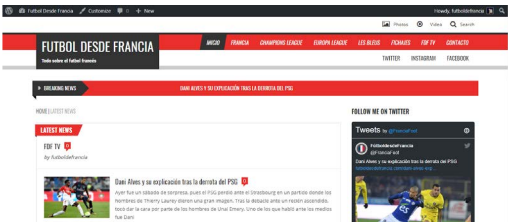
Captura de pantalla primera versió després de modificar l'aspecte del lloc web