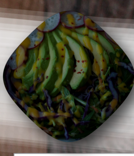
Fotografía para "The Loft"