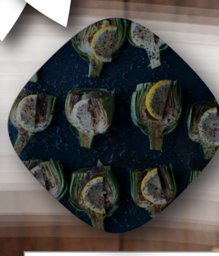
Producción para "LA"