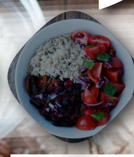
Estilismo en "La Escaletta"