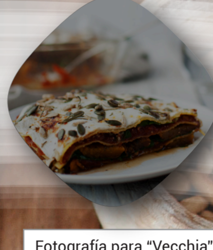
Fotografía para "Vecchia"