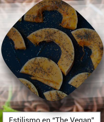
Estilismo en "The Vegan"