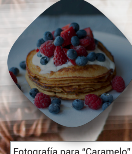
Fotografía para "Caramelo"