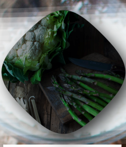
Estilismo en "El Padrino"