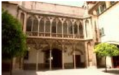
Il·lustració 8: Hospital General http://www.baleareslive.com/info_lugar.php? p=hospital-general-antigua&id=252&l=es

Així mateix, trobem referències al treball femení a l'Hospital General de la ciutat, que podem observar a l'imatge, i que fou creat pel Reial Privilegi del Senyor Rei Don Alonso de 29 de maig de 1456, i que unificaren els tres que, fins llavors, existien a la ciutat. (Tejerina, 1981, pàg.94)