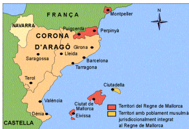
CREACIÓ DEL REGNE DE MALLORCA (1276)