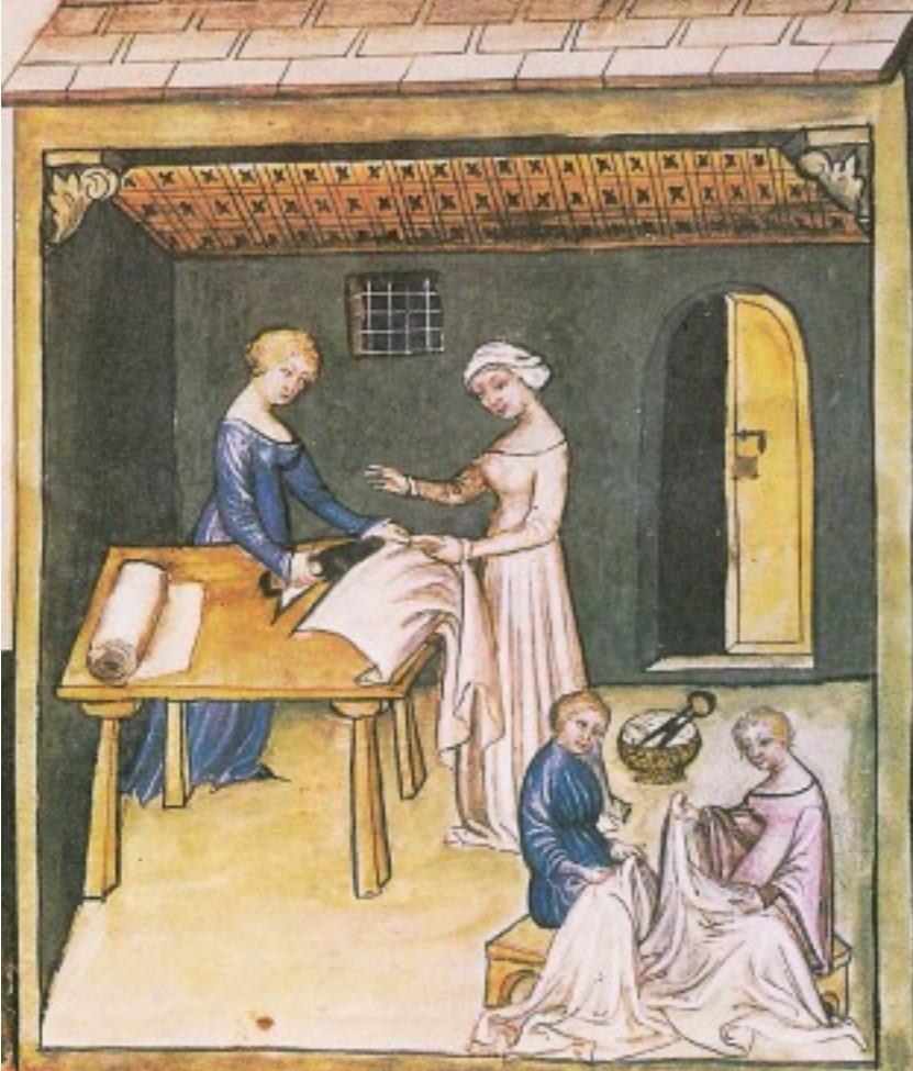
Il·lustració 1: Cosidores. Es té constància documental que al segle XIII es creà un gremi de cosidores a Ciutat de Mallorca.