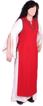
Il·lustració 7: Brial