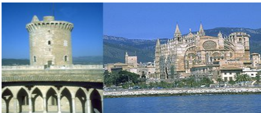
Il·lustració 4: Castell de Bellver i Seu de Mallorca