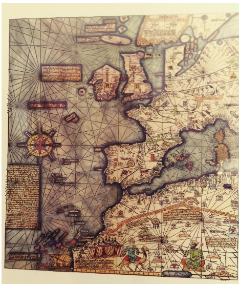
Il·lustració 5: Part de la composició L'Europa de 1375 de la família Cresques. Exemplar propietat de l'autora del present treball.

Pel que fa a l'economia durant aquell període, “el comerç i la mercaderia foren la base de l'economia de Mallorca durant els segles XIII a XV” (Barceló, 2012, pàg.72) En el sector primari trobem el cultiu de l'olivera, la vinya i els cereals. El sector manufacturer, sobretot els teixits, així com la vida comercial, es va ampliar. El seu port, estratègic, es va convertir en eix de moltes rutes comercials i donà lloc a l'establiment de consolats a Mallorca de potències com Gènova o Venècia i, de retruc, consolats de Mallorca en llocs com Marroc, Alger o Tunísia. Tota aquesta activitat “comportava una abundant demanda de treball caracteritzada per la varietat i complexitat de les tasques. Així la demanda de treball englobava des de la construcció d'edificis – públics i privats-, el transport i tragí de mercaderies dintre de la ciutat, el treball als molls, en els magatzems i botigues dels comerciants, en els tallers dels menestrals, el servei domèstic, i també les tasques agràries.” (Jover i altres, 2006, pàg.39)