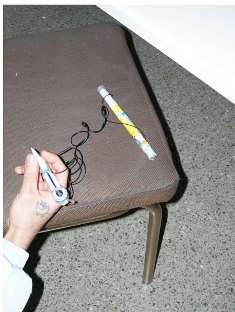
Centre penitenciari de Quatre Camins, 2005

A continuació, És convenient descriure el procés, la tècnica o el procediment. Explicar en què consisteix la pràctica social escollida, i també descriure els diversos elements que hi intervenen.