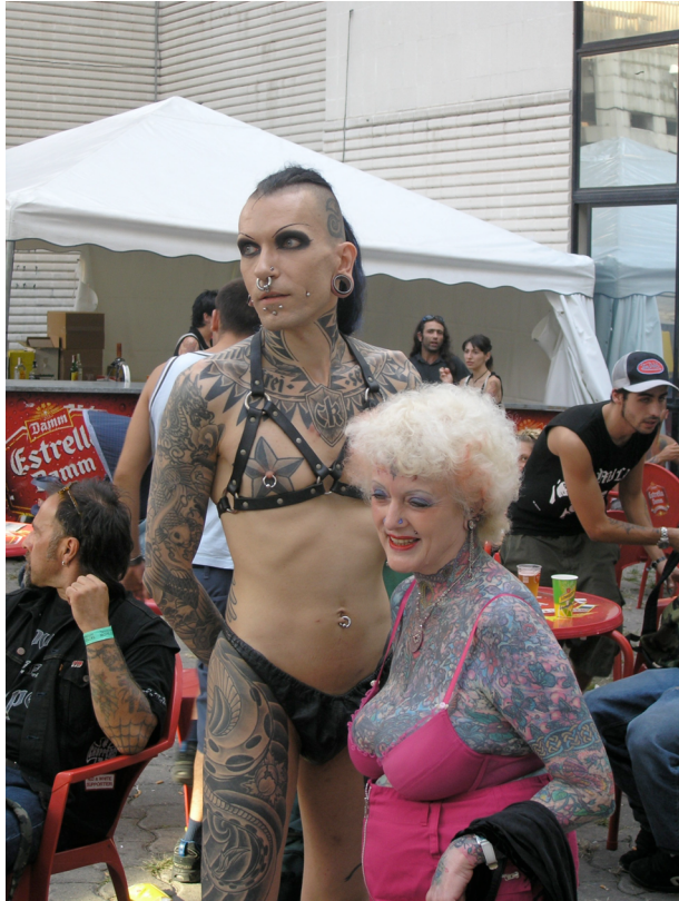
Convenció del Tatuatge, Barcelona 2004