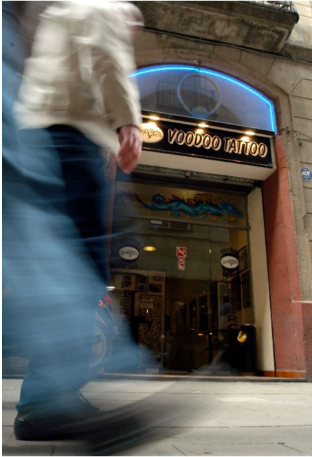
Convenció del Tatuatge, Barcelona, 2004

Les pràctiques del tatuatge actuals, amb els nous dissenys i també els estils anomenats tribals procedents de diferents llocs del planeta però que han estat sotmesos als corresponents processos d'estandardització, han esdevingut molt populars. A Barcelona, per exemple, en els darrers deu anys els estudis de tatuatge s'han incrementat de manera tan notable que l'administració s'ha vist obligada a regular el sector.