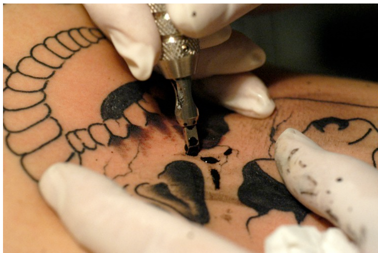
Estudi de tatuatge Voodoo, Barcelona, 2004

lloc, per la utilització del concepte tècniques de modificació corporal per a categoritzar el tatuatge. En segon lloc, per a distanciar aquestes pràctiques de les pràctiques de modificació que podrien considerar-se "mèdiques" o "terapèutiques". I, finalment, per relacionar aquesta pràctica concreta amb altres pràctiques semblants arreu del món, es a dir, cal entendre aquesta pràctica en el conjunt d'altres pràctiques similars... Aquesta és una estratègia antropològica!