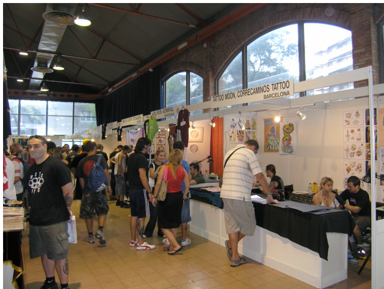
Convenció del Tatuatge, Barcelona, 2004

Identitat ètnica i de reconeixement de pertànyer a un grup social. Aquí veiem dos exemples contraposats: una dona maori i un pres. Per a la dona maori, el tatuatge és un signe de la seva identitat personal –la seva signatura–, de classificació dins del grup –gènere, etc. i d'identitat ètnica. És un resignificat per a valorar la tradició, una reivindicació de la identitat ètnica en un món globalitzat. En el cas següent, el tatuatge del presoner és una expressió de la reivindicació i valoració de la seva identitat estigmatitzada, que s'oposa a la de la policia.