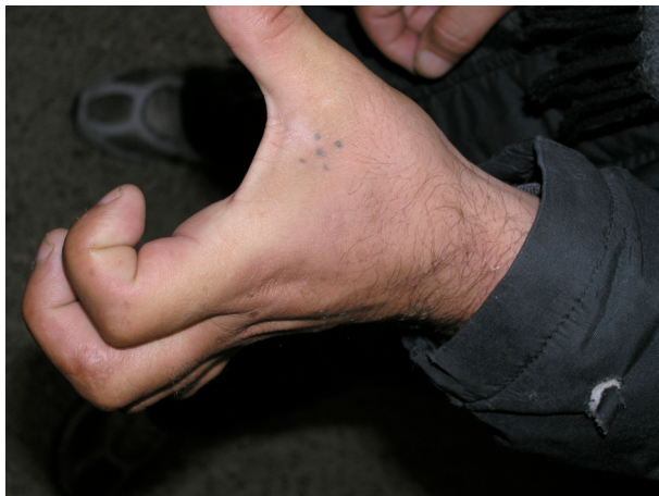
Centre penitenciari de Quatre Camins, 2005

[2] Vegeu P. Bohannon, op. cit. , pàg. 195.