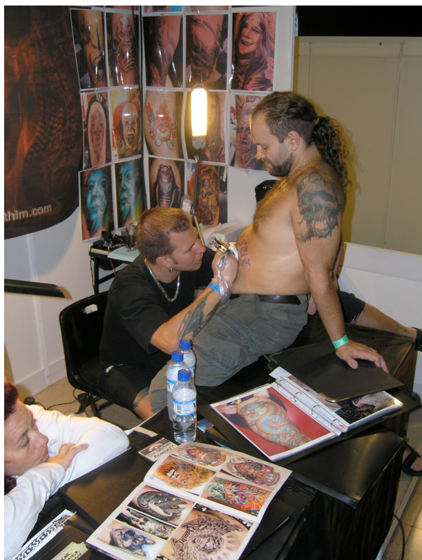
Convenció del Tatuatge, Barcelona, 2004

Es tria el dibuix del catàleg que es vol fer gravar a la pell. La majoria de les tècniques de modificació corporal impliquen dolor. Amb les tècniques modernes de tatuatge, el dolor s'ha reduït considerablement, però continua present. Això no representa, però, cap obstacle seriós per a qui vulgui sotmetre's a aquestes tècniques. El dolor que cal suportar contribueix a marcar el sentit de transcendència que té l'experiència, ja que un tatuatge és un afegit que es fa al cos propi per sempre. En cultures preindustrials, el dolor que produïa el tatuatge era vist com una prova de valor, i això, en certa mesura, continua essent vàlid també per a la nostra societat actual. El dolor assumeix significació social [3]. [3] Vegeu Michela Fusaschi (2003). I Segni Sul Corpo: Per Un'antropologia Delle Modificazioni Dei Genitali Femminili (pàg. 106). Torí: Bollati Boringhieri.