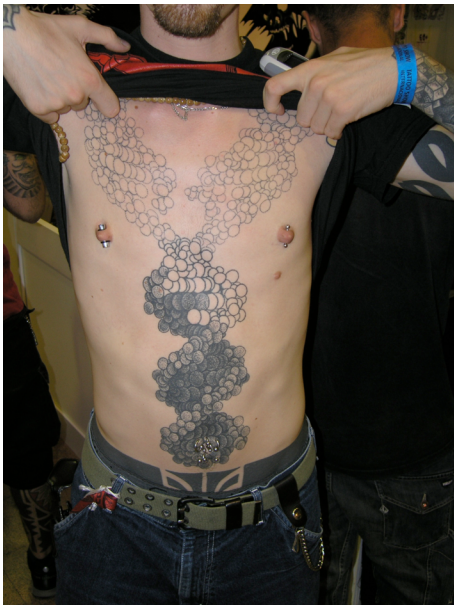
Convenció del Tatuatge, Barcelona, 2004

La contrastació amb altres pràctiques socials, la comparació intercultural, ens pot permetre fer aflorar aspectes que donàvem per descomptat i relativitzar les nostres assumpcions o pressupòsits.