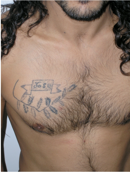
Centre penitenciari de Quatre Camins, 2005

D'estils de tatuatges en trobaríem molts i de molt diferents. N'hi ha de força tradicionals, fets per persones poc o gens professionals i que trobem de manera molt especial en determinats àmbits socials, com casernes i presons.