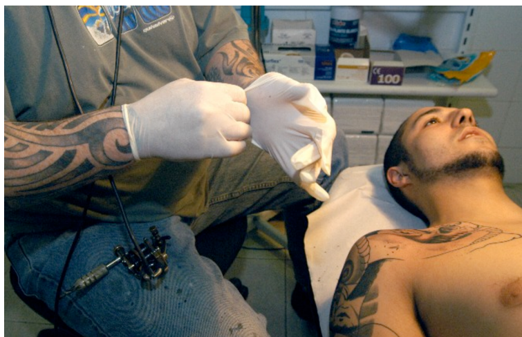
Convenció del Tatuatge, Barcelona, 2004

Es tria el dibuix del catàleg que es vol fer gravar a la pell. La majoria de les tècniques de modificació corporal impliquen dolor. Amb les tècniques modernes de tatuatge, el dolor s'ha reduït considerablement, però continua present. Això no representa, però, cap obstacle seriós per a qui vulgui sotmetre's a aquestes tècniques. El dolor que cal suportar contribueix a marcar el sentit de transcendència que té l'experiència, ja que un tatuatge és un afegit que es fa al cos propi per sempre. En cultures preindustrials, el dolor que produïa el tatuatge era vist com una prova de valor, i això, en certa mesura, continua essent vàlid també per a la nostra societat actual. El dolor assumeix significació social [3]. [3] Vegeu Michela Fusaschi (2003). I Segni Sul Corpo: Per Un'antropologia Delle Modificazioni Dei Genitali Femminili (pàg. 106). Torí: Bollati Boringhieri.