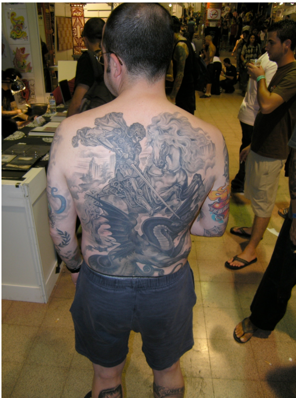
Convenció del Tatuatge, Barcelona, 2004

Però avui són com més va més els professionals els que poden estar cofois d'unes innegables aptituds artístiques.