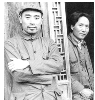
Mao Zedong i Zhou Enlai el 1937

El final de la guerra civil es va viure amb expectació. S'havia posat fi a dècades de guerra i divisió territorial, les clàusules injustes dels tractats amb els països occidentals havien quedat revocades i la Xina es disposava a entrar en una era nova. El Partit Comunista havia donat mostres de la seva eficàcia i tenia el suport i l'admiració de milions de xinesos, que el veien com l'esperança que havia de posar fi a tants anys de tribulacions.