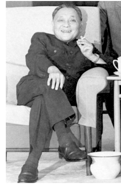
Deng Xiaoping

Amb l'avaluació del llegat del partit, es va iniciar la rehabilitació dels líders que havien estat perseguits durant algunes de les campanyes maoïstes, entre d'altres, Liu Shaoqi –mort durant la Revolució Cultural–, considerat de manera oficial un traïdor a l'Estat i al partit. En el mateix context, el 1980 es van iniciar els judicis a la Banda dels Quatre. Els seus membres van ser acusats de causar la mort de 35.000 persones durant la Revolució Cultural i d'haver mantingut vincles amb el Kuomintang al començament de la revolució. Jiang Qing i Zhang Chunqiao van ser condemnats a mort (encara que mai executats), Wang Hongwen a cadena perpètua i Yao Wenyuan a divuit anys de presó. Amb l'avaluació de l'obra de Mao, la relegació de Hua Guofeng i la condemna de la Banda dels Quatre, Deng havia aconseguit eliminar qualsevol vestigi d'esquerranisme radical i havia deixat clara la línia política per la qual apostaria.