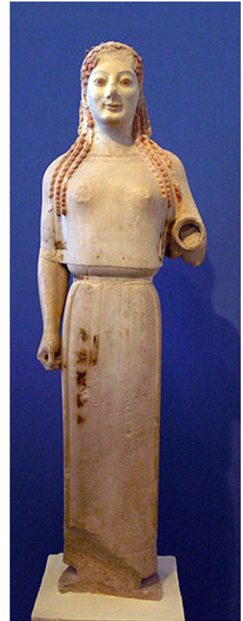
Cora d'època arcaica (ca. 530 aC) conservada al Museu de l'Acropolis d'Atenes