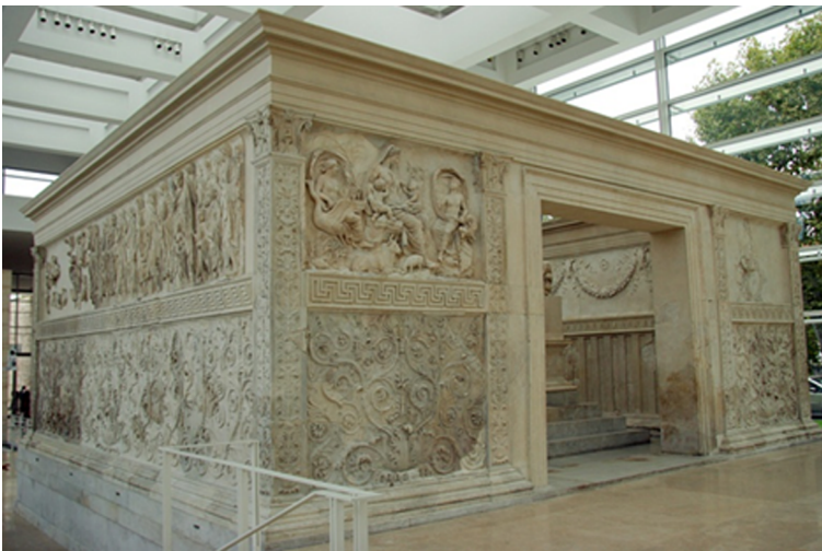
Ara Pacis Augustae